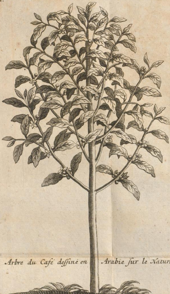
Arbre du Café dessiné en Arabie sur le Naturel