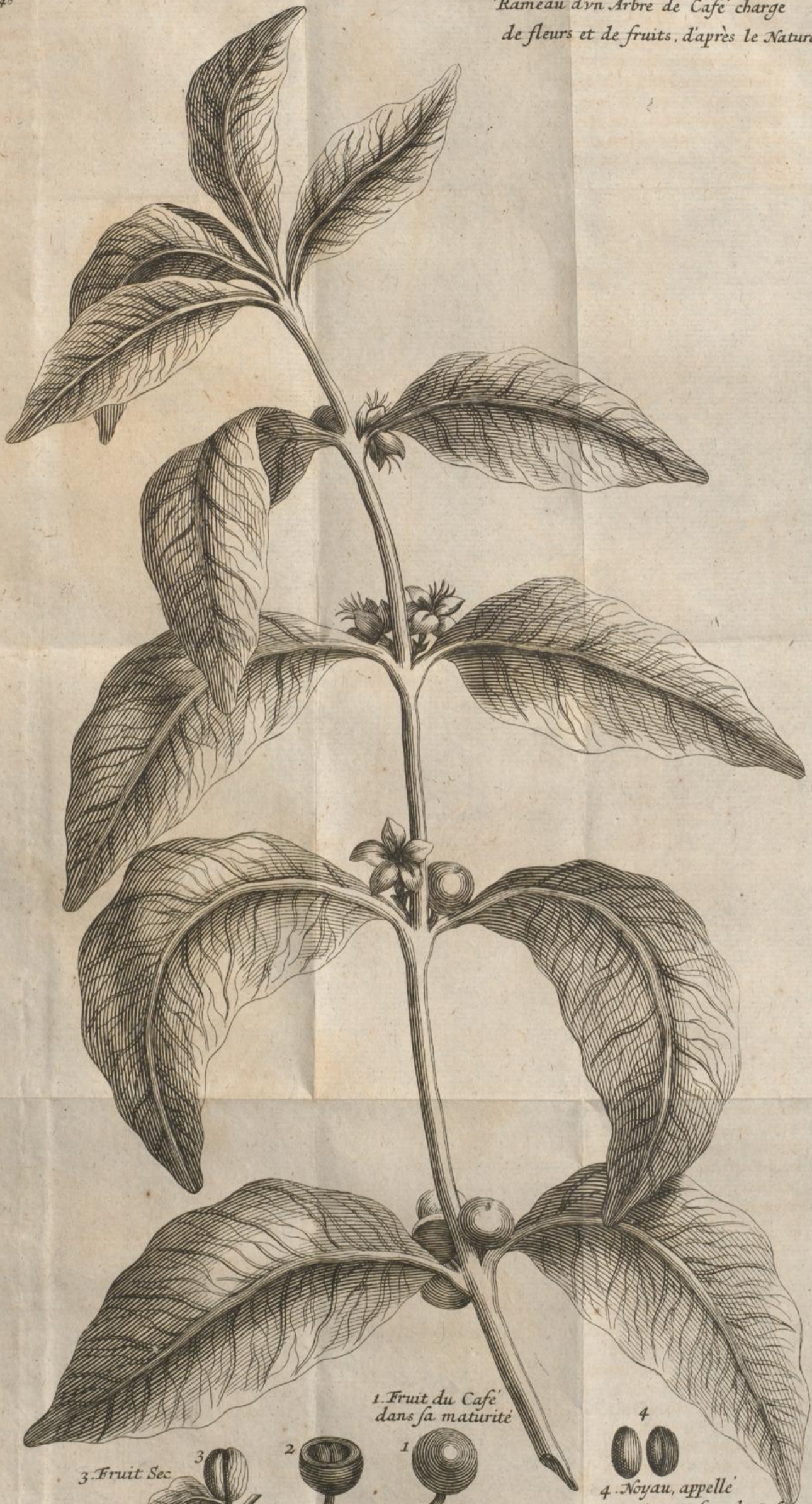
1. Fruit du Café dans sa maturité