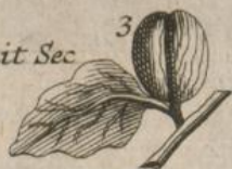
3. Fruit Sec