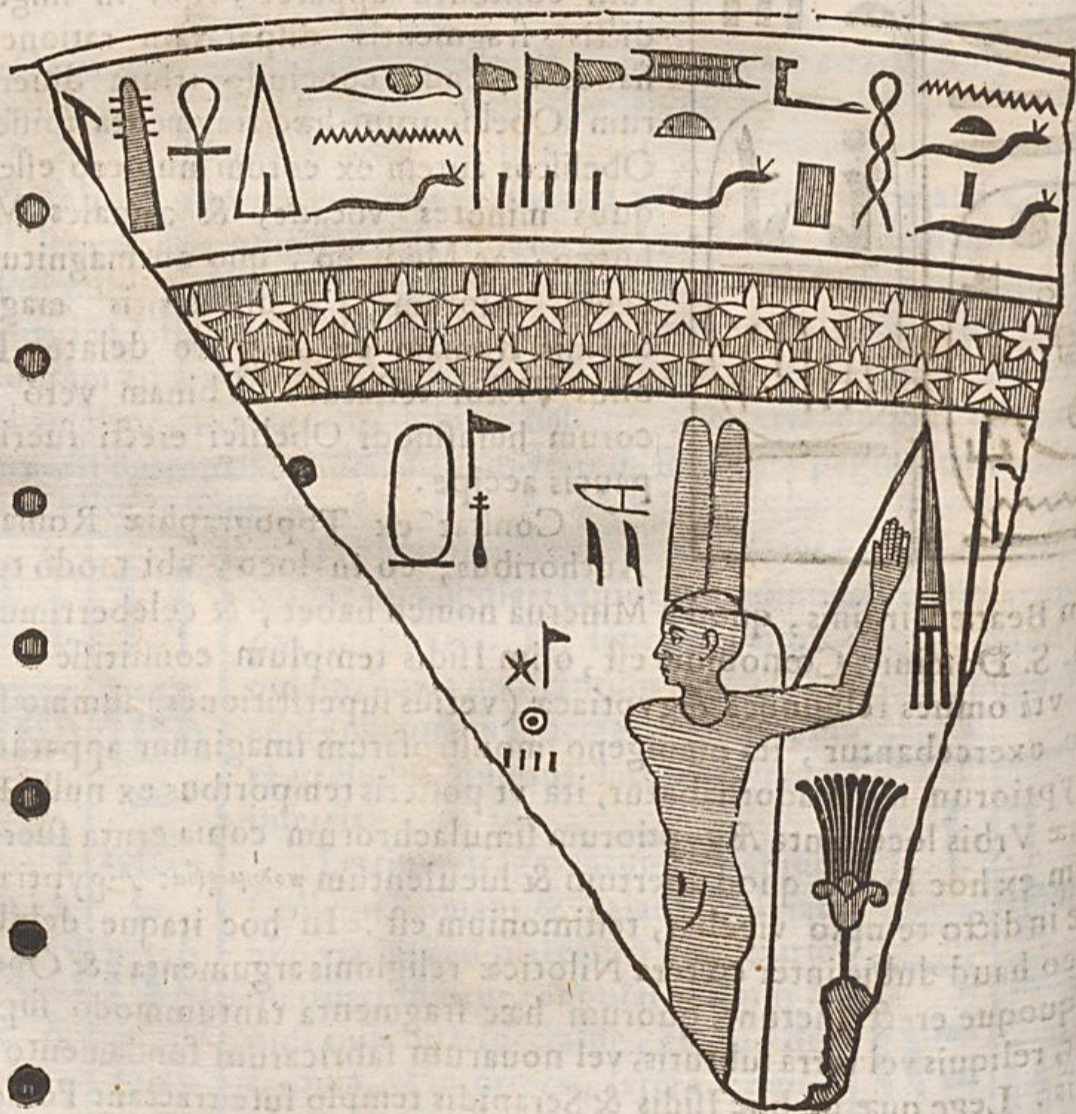
Fragmentum vasis Nilotici ex Museo Authoris.

Inter alia fragmenta magnæ considerationis sunt ea quoque, quæ in tabula VIII. proponit Nardius, ex Museo Gaddiano Florentino deprom-