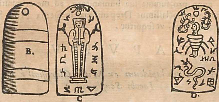
Figuræ ex Reinstiano Museo.

Quartum Amuletum pariter Scarabæi figura H, in ventre inscriptionem portat, signatam literâ I, & est Eques gladio euaginato minax; quem ambiunt characteres hieroglyphici, sed eius formæ, quas currentes vocant; quorum genuina interpretatio est, ut sequitur. Prima & octava figura indicat statuam Cynocephali seu Genij Anubici; Secunda duos pedes exhibet hemicyclo insistentes, quo occultus Numinis inferioribus se insinuantis motus notatur; Tertia & Sexta Accipitri- nos Osiridis ministros indicant; Quarta Dæmonem polymorphum; Quinta Crucem ansatam diuini influxus indicem; Septima Isidis caput refert. Horum itaque Numinum præsidio, in bello (quod per Equum, & armatum hominem notatur) Regi stipato victoria contra inimicos promittitur.