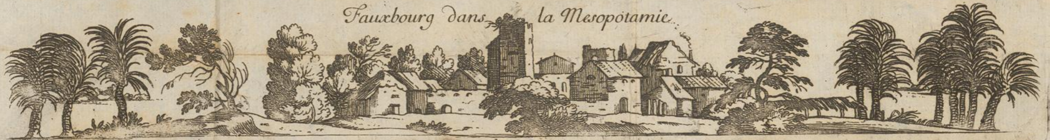
Fauxbourg dans la Mesopotamie