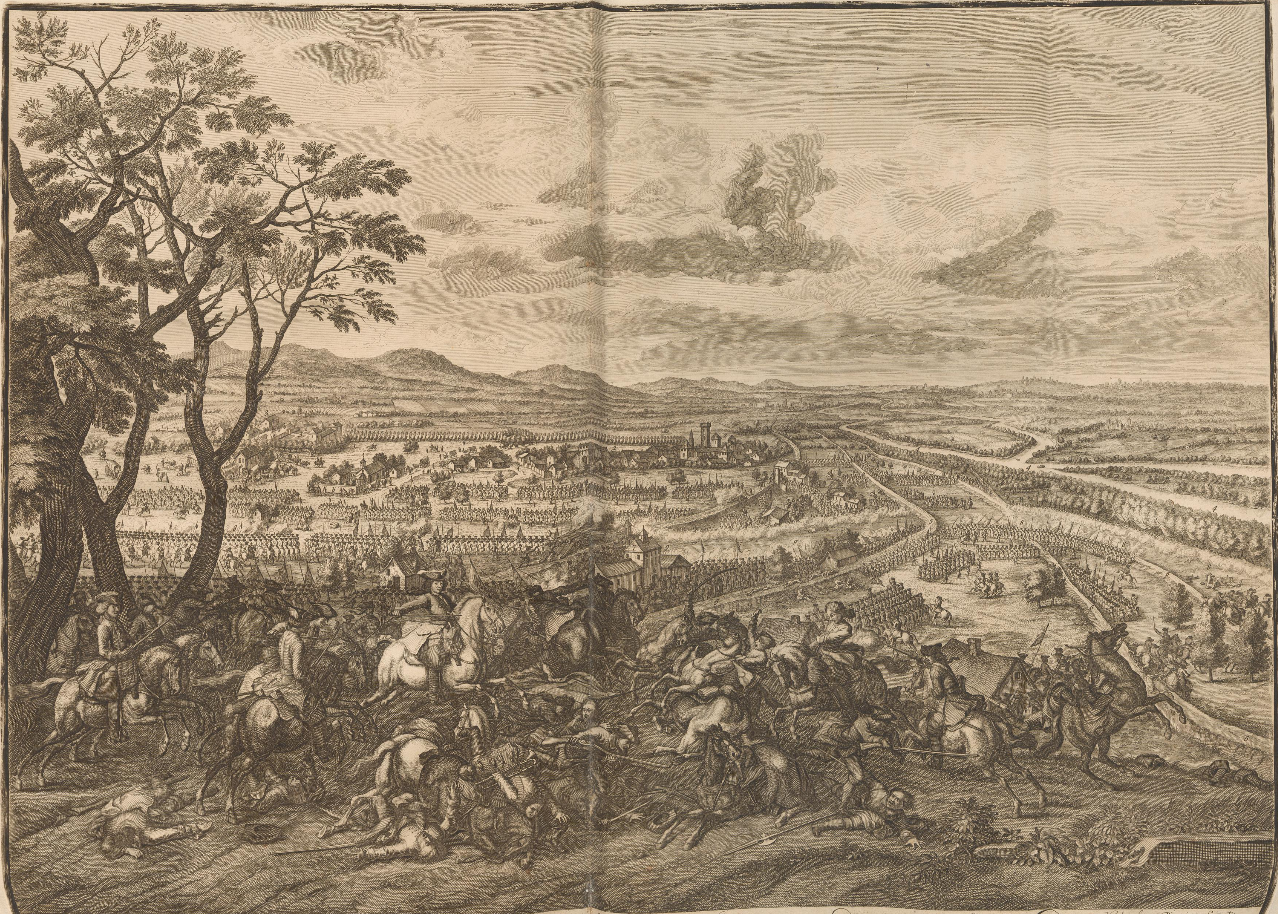
Vue et Representation de la Bataille de Luzzara donnée le 15 D'aoust 1702. Hüchtenburg, Pinxit et Excudit 1. Le Prince Eugenes . 2. Luzzara . 3. La Tomba Caffine . 4. Le Po Fleuve . 5. Grande Digue du Po . 6. Autres Diques . 7. Caffine . 8. Ataque des Impericaux . 9. Lieu le plus fort du Combat .