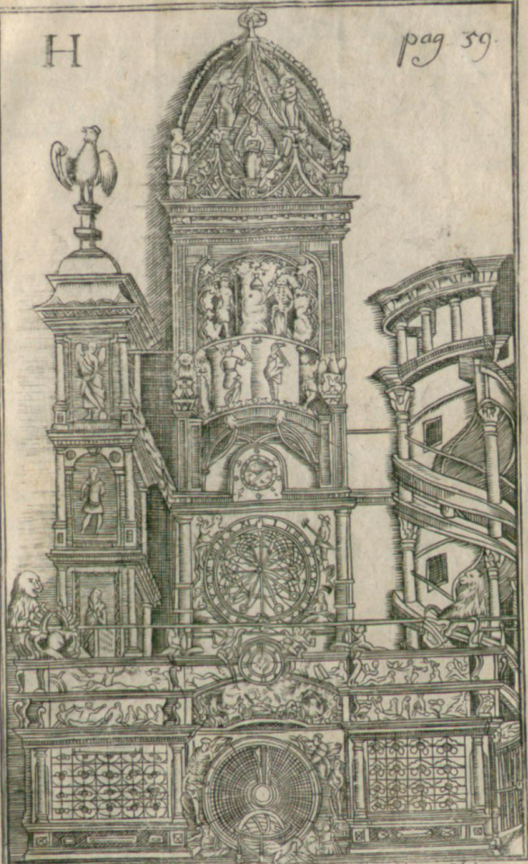
Die Ubr im Heinstler zu - Strasburg