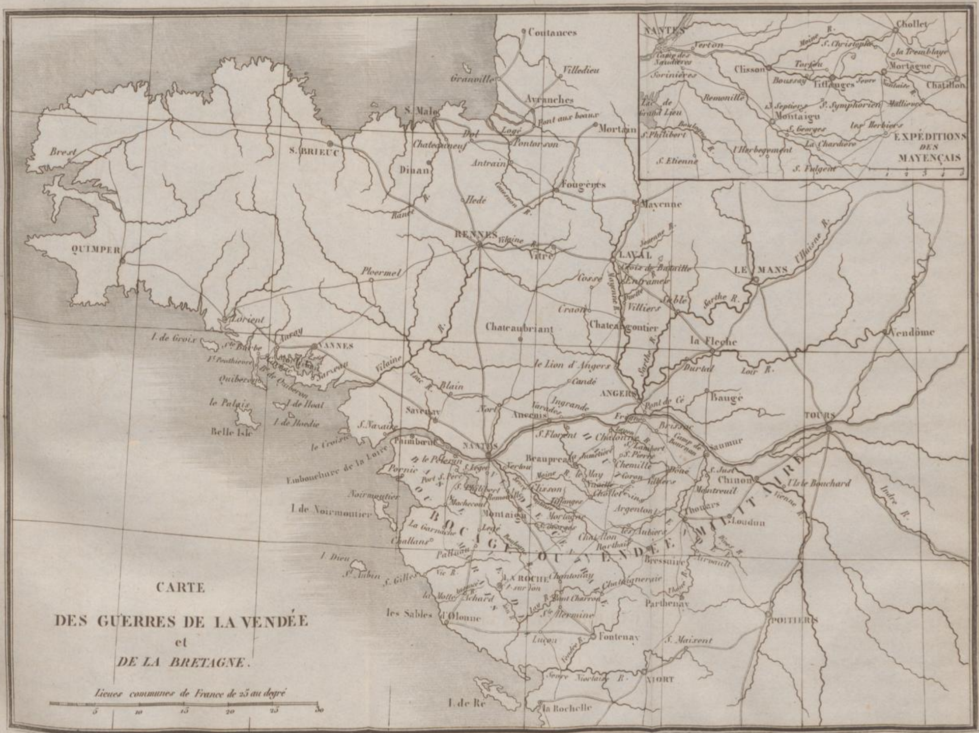
CARTE DES GUERRES DE LA VENDÉE et DE LA BRETAGNE.

Lignes communes de France de 25 au degré 5 10 15 20 25 30