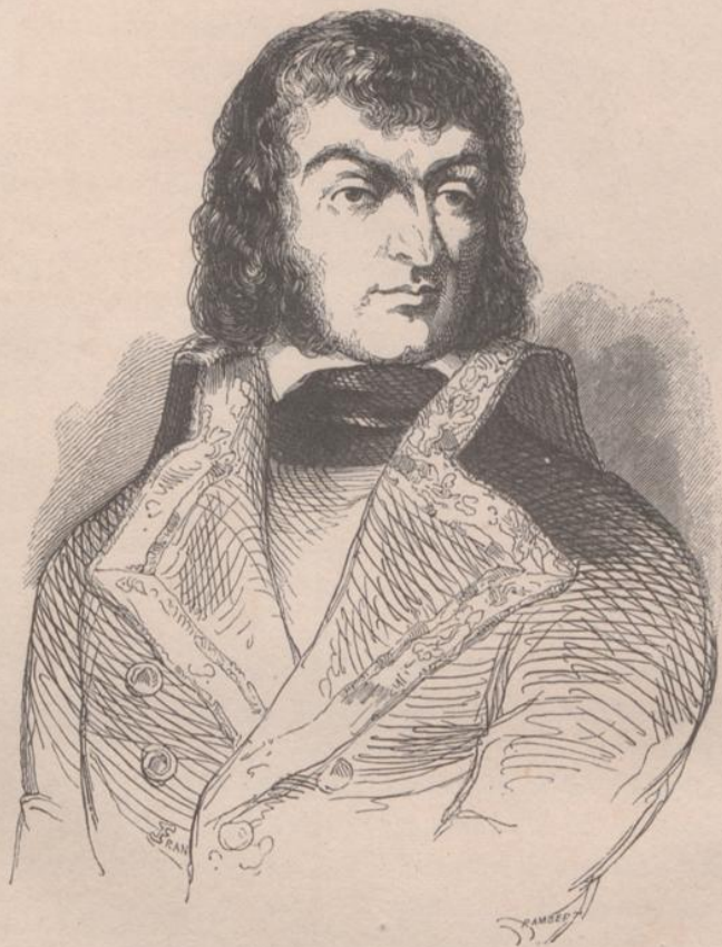
JOUBERT ( Barthélemy-Catherine ),

Né à Pont-de-Vaux le 14 avril 1769.—Général en chef de l'armée de Hollande,—de l'armée de Mayence, — de l'armée d'Italie en 1798.—Tué en 1799.