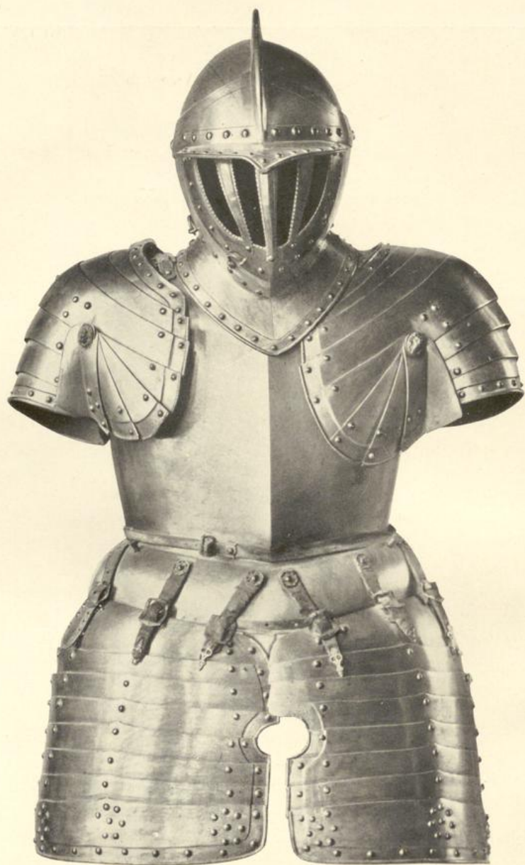
Plattenharnisch aus dem XVII. Jahrhundert.