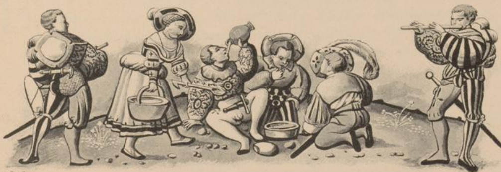
Lagerscene (Kappeler Milchsuppe?) auf einem zürcherischen Glasgemälde von 1530.

Die Aufgabe, welche sich der Verfasser gesetzt hat, ist hiemit beendigt. Das weitere über den Bau des Landesmuseums und die Tätigkeit der Museumsbehörden seit 1892 findet sich in den Jahresberichten der Anstalt verzeichnet. Ob die von den Vorkämpfern des Landesmuseums seinerzeit gemachten Verheissungen in Erfüllung gegangen sind, wird das Schweizervolk am Tage der Eröffnung selbst beurteilen.