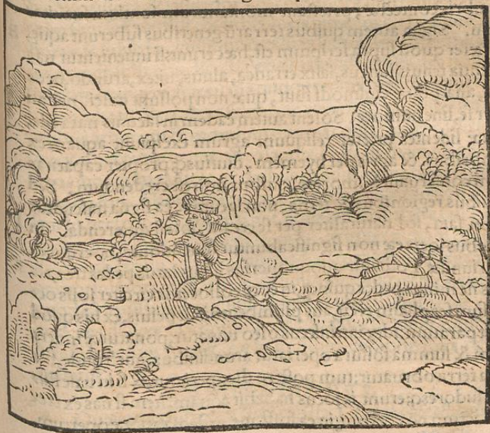
Procumbentis in dentes ut a terreno uapore aque subsistentia inueniatur figura.

putauit, quoniam in prioribus septem uoluminibus rationes ædificiorum sunt expositæ, in hoc oportere de inuentionibus aquæ, quasq; habeat in locorum proprietatibus uirtutes, quibusq; rationibus ducatur, & quemadmodum item ea probetur, scribere. Est enim maxime necessaria, & ad uitam, & ad delectationes, & ad usum quotidianum. Ea autem facilius erit, si fontes erunt aperti, & fluentes. Sin autem non profuerint, quærenda sub terra sunt capita, & colligenda: quæ sic erunt experiunda, uti procumbatur in dentes, antequam sol exortus fuerit, in locis quibus erit quærendū, & in terra mento collocato & fulcto, prospiciantur eæ regiones. Sic enim non errabit excelsius quam oporteat uisus, cum erit immotum mentum: sed ad libratam altitudinem in regionibus certa finitione designabit. Tunc in quibus locis uidebuntur humores se conerispantes, & in aëra surgentes, ibi fodiatur: non enim in sicco loco hoc signum potest fieri. Item animad-