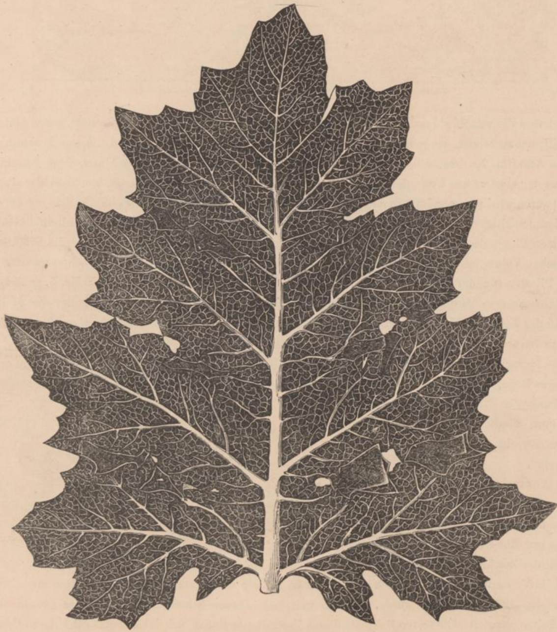
Der Acanthus, vollständige Grösse, nach einer Photographie.

Wir haben es nicht für nöthig erachtet, in dieser Serie einige von den gemalten Verzierungen zu geben, von denen sich manche Reste in den römischen Bädern befinden. Denn erstens standen uns keine zuverlässigen Materialien zu Gebot; überdiess sind sie denen von Pompeji ganz ähnlich, und zeigen vielmehr was man vermeiden, als was man befolgen sollte. Deshalb schien es uns hinlänglich zwei Gegenstände vom Forum des Trajan darzustellen, deren in Schnörkel ausgehende Figuren als die Grundlage dieses, in den römischen gemalten Decorationen so hervorragenden Charakterzuges betrachtet werden können.