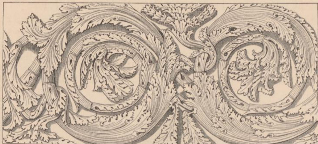
Bruchstück vom Fries des Sonnentempels, Palast Colonna, Rom.—L. VULLIAMY.

Principien, aber man vermisst darin die griechische verfeinerte Auffassung. In den griechischen Ornamenten entspringt ebenfalls ein Schnörkel aus dem andern, aber sie sind viel zarter am Verbindungspunkt. Auch sieht man das Acanthusblatt, so zu sagen, im Seitenaufriß. Die rein römische Anwendungsweise des Acanthusblattes zeigt sich an den korinthischen Kapitälern und in den Mustern der Tafel XXVI. und XXVII. Die Blätter sind abgeplattet und liegen über einander, wie im Holzschnitt hier unten.