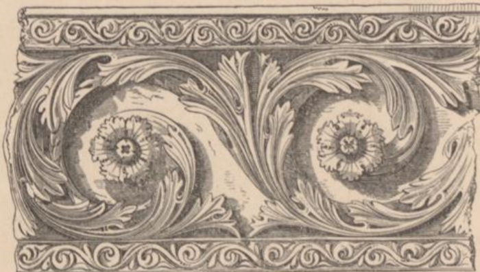
Von der Abtei St. Denis, Paris.

Die Anwendung dieses Principiums, ein Blatt innerhalb des andern, oder ein Blatt über das andere entspriessen zu lassen, liefert übrigens nur eine sehr beschränkte Mannichfaltigkeit der Zeichnung; und die rein conventionelle Verzierung entwickelte sich erst, als dieses Princip der in ununterbrochener Linie aus einander entstehenden Blätter beseitigt wurde, um dem ununterbrochenen Stamm zu weichen, der Ornamente an beiden Seiten auswirft. Die ersten Beispiele dieser Veränderung finden sich in der Sophienkirche zu Constantinopel; und wir geben hier ein Muster von St. Denis, in welchem zwar das Schwellen am Stamme sowohl, als