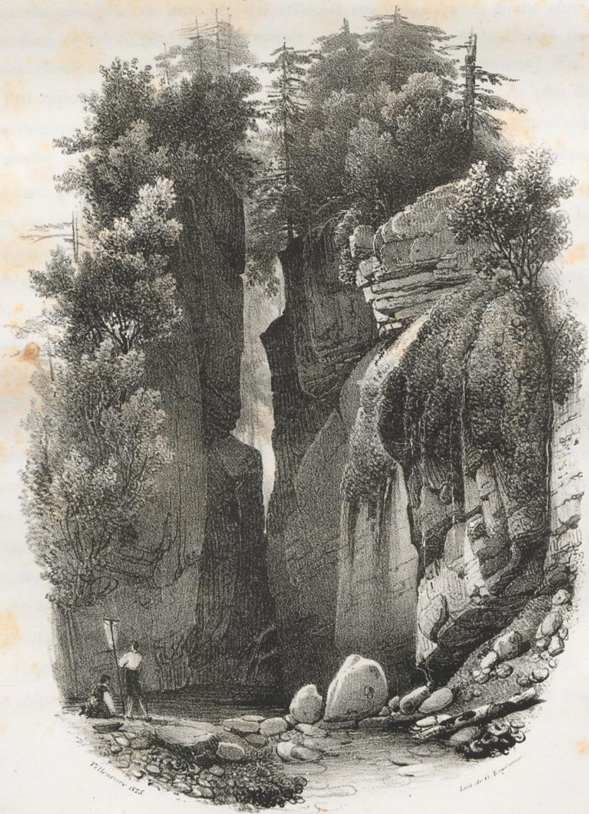
Rocher du Rengloch, près Lucerne.

détails piquants d'un paysage sauvage ; ou plutôt, il faudrait, non plus du papier et des crayons, mais une toile et des couleurs, pour peindre ces masses d'un tuf doré déposées sur la surface du rocher noirâtre, et cette verdure veloutée de la mousse qui les couvre, et ces filets argentés d'une eau limpide qui, s'infiltrant dans les innombrables fentes de cette pierre poreuse, ruissellent de toutes parts sous la forme d'une pluie abondante, et ces jets d'une vive lumière, qui viennent subitement illuminer le rocher humide et la cascade écumante. Mais comment porter une boîte de couleurs, ou dresser un chevalet dans un lieu pareil ? Comment encore tenir un pinceau et une palette, devant de pareils objets ? L'art ne saurait pénétrer dans ces sanctuaires de la nature, sans se sentir pénétré lui-même de sa faiblesse ; et c'est le charme de son impuissance, d'adorer ici et de respecter son modèle. Je suis, etc.