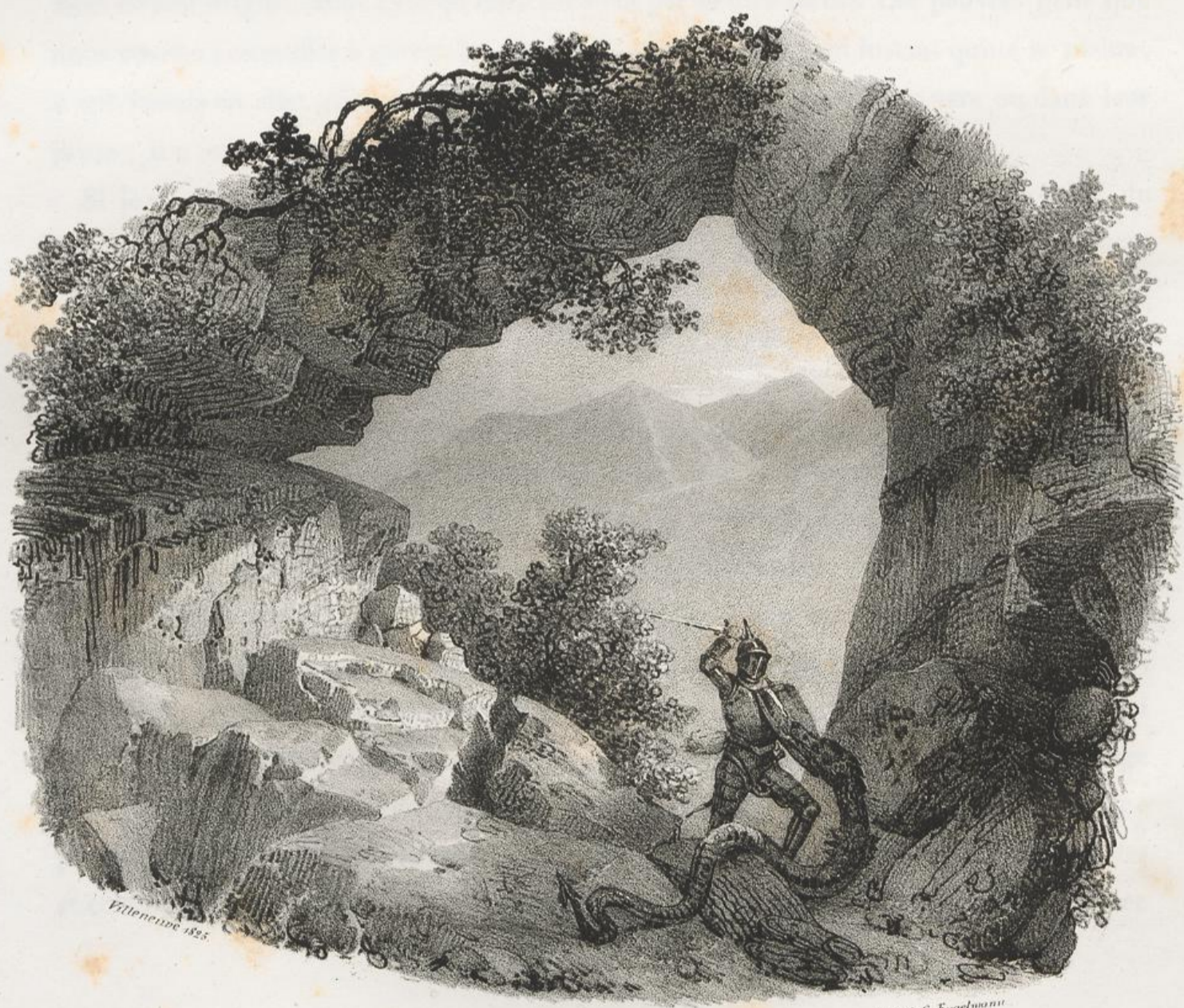
Grotte du Dragon, ou le Drachenloch près Stantz.

l'ancre du Dragon. On n'y parvient qu'avec assez de peine, par un sentier très-roide et très-étroit, et en s'aidant des mains autant que des pieds. Mais en arrivant dans la grotte, son aspect nous dédommagea de nos fatigues. L'ouverture en est large et presque régulière, et les parois en sont formées de beaux rochers calcaires. Assis à l'entrée, et nous reposant à la fraîcheur de son ombre, nous avions sous nos pieds la vallée du Drachenried , actuellement si fertile et si riante, et devant nous, les belles montagnes de la Blumalp et du Buochserhorn. Notre guide nous montrait avec une émotion, qui, mieux que son récit même, attestait sa conviction, la caverne qui se prolonge dans la profondeur de la montagne, et qui servait de repaire au monstre. Nous jouissions presque de sa frayeur, autant que du spectacle enchanteur qui se déployait à nos regards; et le charme de ces beaux lieux, et l'intérêt de ces vieux souvenirs, et ces grandes ombres du temps passé que le récit de cet homme simple et naïf évoquait pour ainsi dire au milieu de nous, nous auraient retenus long-temps à cette place, si la nuit ne nous eut forcés de la quitter. Je suis, etc.