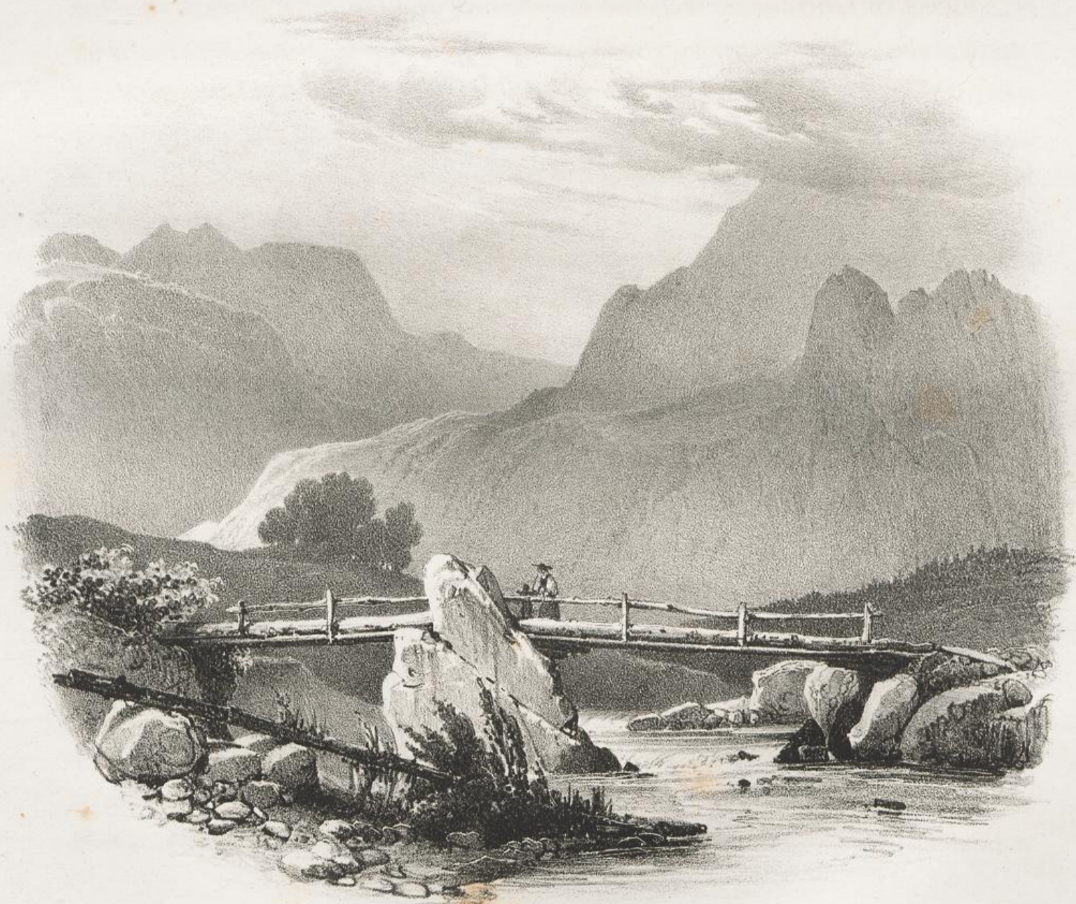
Pont sur la Linth.

Nous eûmes bien de la peine à regagner notre chemin , en escaladant des rochers tout humides , et en traversant un champ de rhododendrons également humectés par la pluie. Nous étions nous-mêmes trempés à faire pitié ; mais l'orgueil d'avoir emporté notre dessin , pour ainsi dire à la pointe de l'épée , malgré l'orage déchaîné contre nous , ne nous permettait pas de nous plaindre de ce petit désagrément ; et , rentrés en triomphe à l'auberge du Linththal , où nous attendait un bon souper et un bon gîte , nous eûmes bientôt perdu , au sein d'une satisfaction si légitime et d'une hospitalité si douce , jusqu'au sentiment de nos fatigues. Je suis , etc.