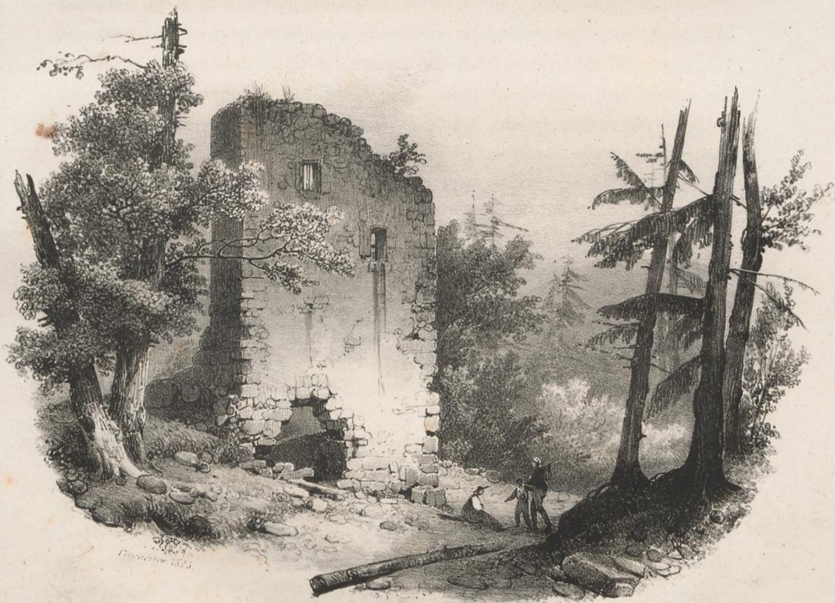
Tour de Gessler à Künisnacht.

Les autres stations du Righi , dont j'aurais à vous parler , Madame , se recommandent par ce double motif d'intérêt. C'est toujours la religion et la liberté qui les consacrent ; et l'idée de Dieu s'y associe toujours à l'image de Guillaume Tell. L'hospice de Notre-Dame-des-Neiges, où nous avons couché le second jour de notre voyage au Righi, ne reçoit pas de pèlerin , qui n'ait commencé ses dévotions dans la chapelle de Guillaume Tell , bâtie au pied de la montagne, et qui n'ait envisagé de loin les restes du château de Gessler. N'est-ce pas quelque chose de touchant , que de voir, après plus de cinq siècles , tout un peuple reconnaissant s'incliner sur le berceau de sa liberté , et prier Dieu , sur l'autel consacré à un héros , à la vue de l'asyle détruit d'un tyran ? Quoiqu'on en puisse dire , cette religion-là en vaut bien une autre ; et si c'est de la superstition , que ces illusions d'un peuple libre , j'attends , pour les condamner , que la philosophie se produise aux mêmes œuvres. Je suis , etc.