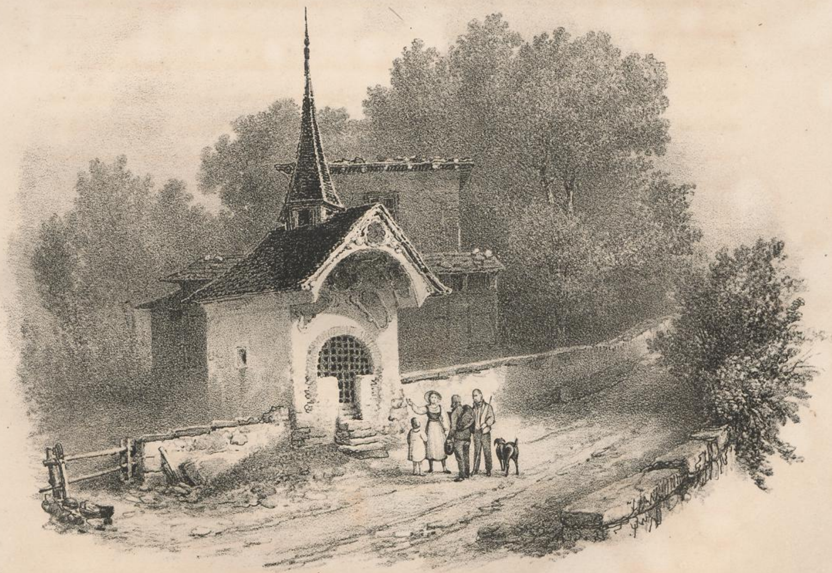
Maison de Tell à Burglen.

Ici, Madame, se termine notre voyage aux rives du lac des quatre cantons. Nous y avons vu la nature dans toute sa pompe, et l'humanité dans toute sa grandeur. Commencé à Sempach, il aboutit au Grütly ; il est ainsi renfermé tout entier entre les deux héros de la Suisse, aussi bien que dans les limites du plus beau de ses lacs ; et en vous adressant ces souvenirs, du sein de la patrie même de Guillaume Tell, c'est pour nous un nouvel avantage, que ces dernières lignes consacrées à l'amitié puissent s'honorer de ce dernier hommage rendu à un grand homme. Je suis, etc.