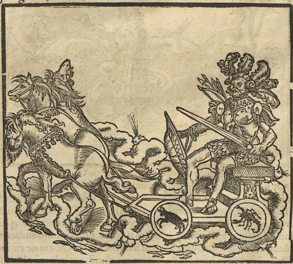
De Mercurio in radice natiuitatis Cholericorum. S I N A V T E M in radice fuerit, locatus autē perperā. i. in domo Saturni, uel Martis, & nullū habuerit aspectum benignū, aut cōmixtionē Ve

tutis studiosi sunt: tam sine mente, ut solus sibi sapere uideat: tam cecus, ut nulli unq̄ bono precari bene possit. nisi Veneris accedat delinimentū, quę quia frigida est, & humida, ob insitū natura frigus, remittit nōnihil alterius feruorē. Carnē multiplicat, & blandiorē facit hominibus, pro ferocitate iocunditates p̄cipat, & ciuilitatē, oscula, comessatiōes, otium, uoluptates, pulcritudinē, dulcedinē, circūuentiones mulierum. Efficit & peieratorē, scedifragū, uiolatorē iurisiurādi, in sui p̄suis factis parū sollicitū, quę Veneris proprietates sunt. Quāq̄ em̄ nō adeo malę sint, tamē illi us bonitatē alterius contaminat malitia. Omnium pessime seducit ubi domiciliū Saturni permigrauerit, id est Capricornum, uel Aquariū. Aut si Mercurius in domo Martis retrogradus fuerit, hoc est in Ariete, uel Scorpione, tūc em̄ facit impudentē, desperatū, incorrigibilē, maxie ubi bene potus inebriari cœpit: tunc obbrutescens, homo esse desinit. In rebus mœchanicis p̄claros atq̄ spectatos opifices facit, çris aut ferramentoꝝ rū fusores, lanios, carnifices, chyrgicos. Et si accesserit illi Venus, barbifonfores. Si uero Mercurius, qui malagmatis & emplastris occupat se, chyrgicum, uel unctorem.