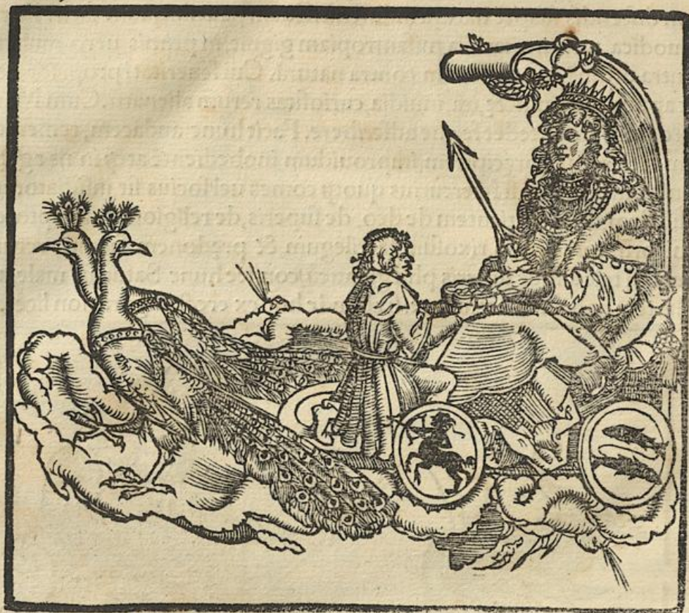
De Marte in radice natiuitatis Phlegmatici.

carnosum nimis. Ornat etiam perquam uenusto capillitio, optimis moribus, optimis gestibus dulci eloquio, pace, religione, sanctimonia, iustitia, ueritate, consilio, misericordia, clementia. In uestibus & corporis decore paulo plus facit curiosiorem, atq; in huiusmodi etiam felicem & prosperum,