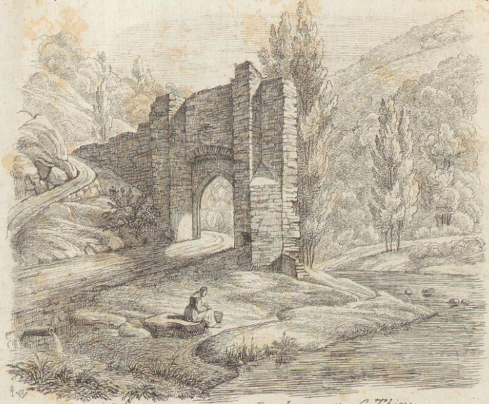
Druckerey von C. Thiess.

Birkenauer Thal , durch welchen man nun hinaustritt, wird von der Neumaurer's Pforte geschlossen. Es sind dies die Trümmer eines aus Stein erbauten Thores, das muthmasslich aufgeführt wurde, um den Pass nach dem Odenwalde zu verwahren.