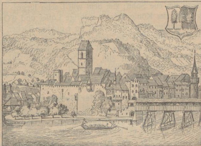
Olten im 16. Jahrhundert.

Als die Belagerung begann, hielt sich Graf Bertold von Kiburg im Schlosse Olten auf. Er leitete die Verteidigung