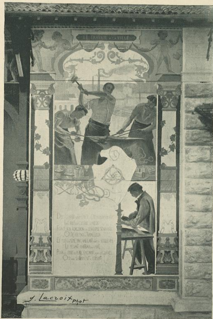
LE TRAVAIL A LA VILLE

Une fois les assistants groupés, les discours commencèrent.