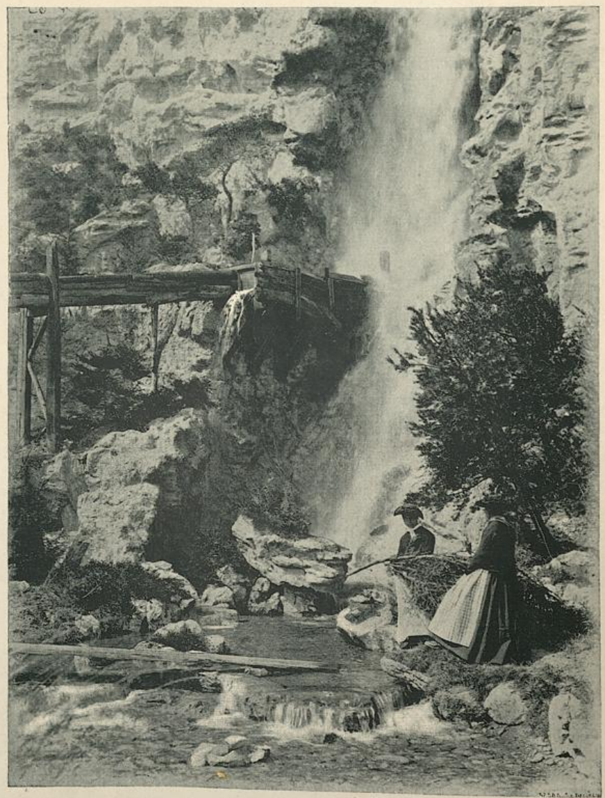
LA CASCADE DU VILLAGE SUISSE