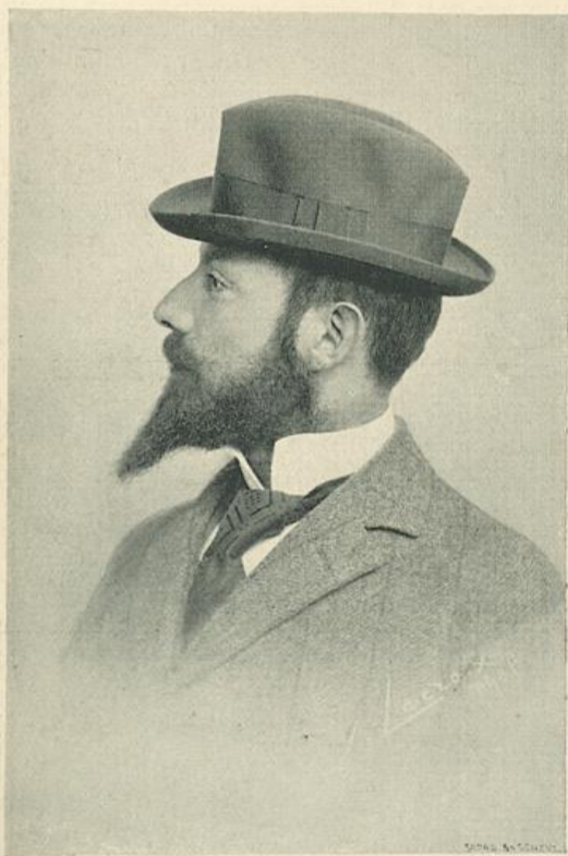
M. ERNEST BIÉLER, peintre

A l'Exposition nationale: La fête d'inauguration; Discours de MM. Turrettini, Lachenal, Deucher; Inauguration du Village suisse; le Banquet officiel; Discours de MM. Didier, Ador, Jordan-Martin, Barrère et Bourdillon. — Die Eröffnungsfeier. — Le Banquet de la presse; le Banquet des dames. — Au Pavillon de l'industrie hôtelière. — La Constitution des Jurys de groupes. — Nos gravures.