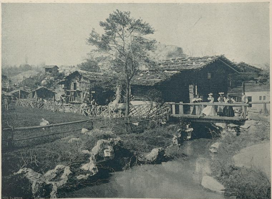
SUR LE PONT (VILLAGE SUISSE)

Vous nous avez choisis, nous les derniers venus dans la famille suisse. La confiance que vous nous avez témoignée nous remplit d'une joie immense, et nous nous en rendons dignes.