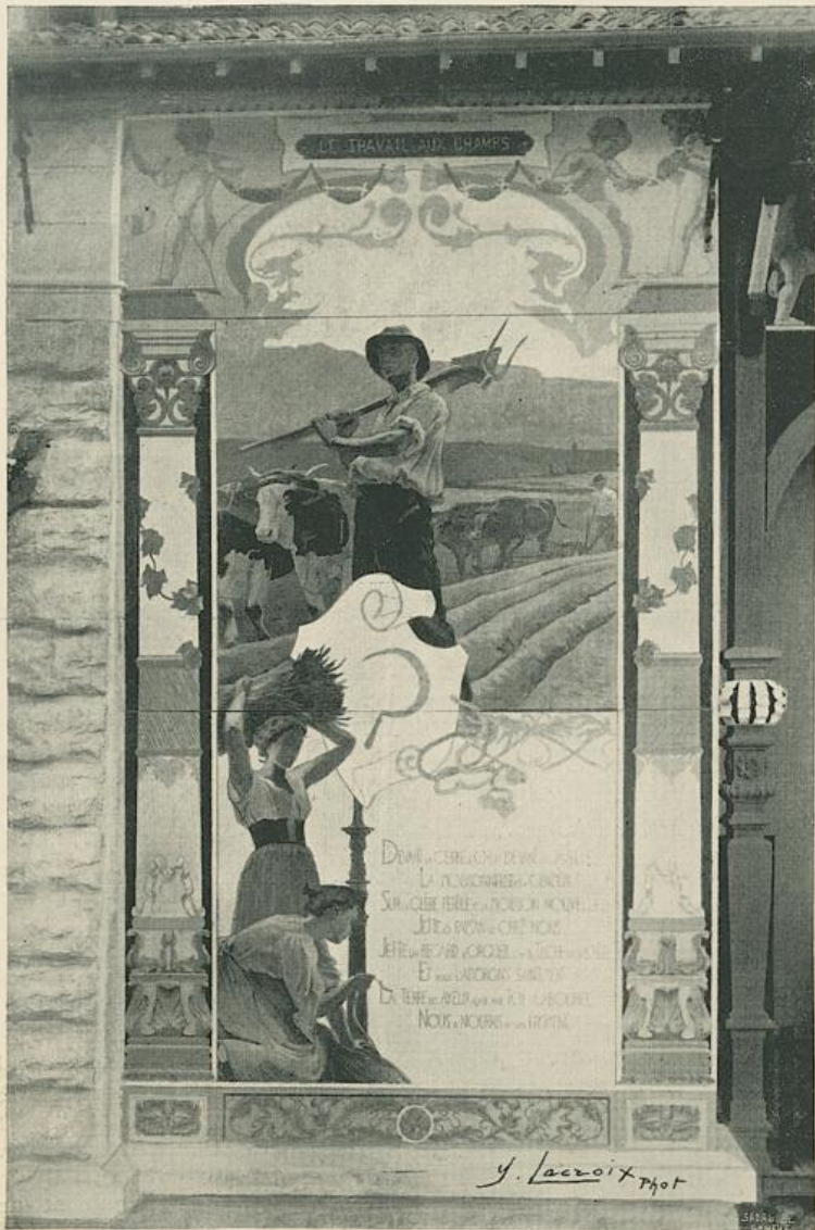
LE TRAVAIL AUX CHAMPS Panneau de M. E. Biéler.