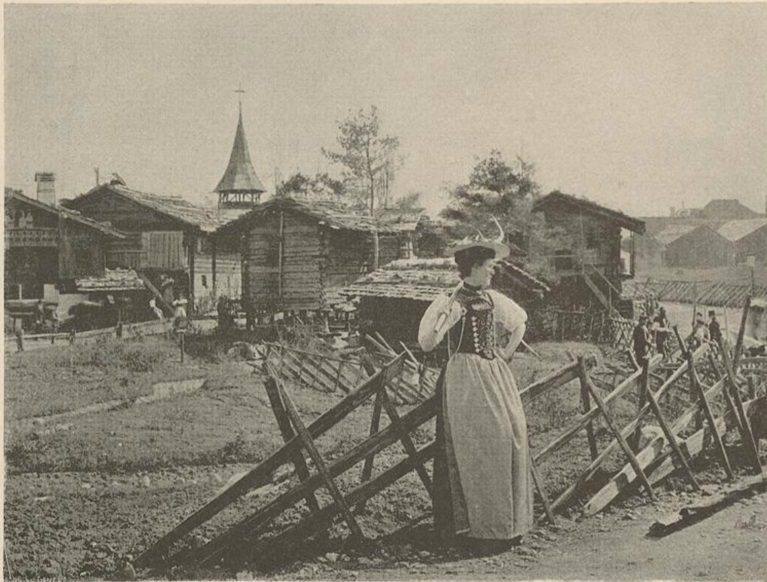
AU VILLAGE SUISSE

l'Etat dans les domaines où il peut efficacement seconder et faire fructifier les efforts individuels, à marcher résolument dans la voie du progrès pour tenir toujours une place honorable dans le concert des nations civilisées.