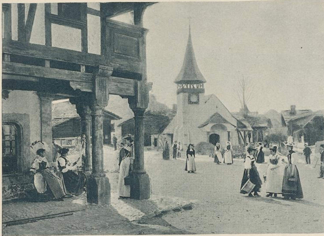
PLACE DE L'ÉGLISE (VILLAGE SUISSE)