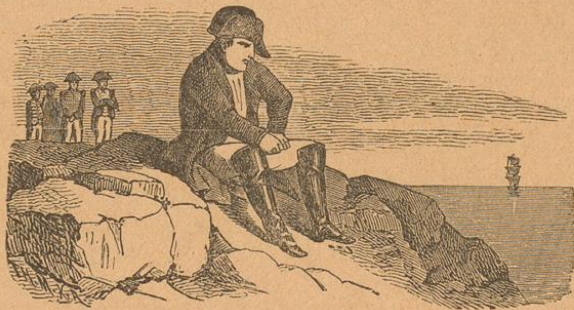
Napoleon I. auf St. Helena.

Es war zu befürchten, Napoleon werde sich in die Schweiz werfen, um hier gegen seine Feinde eine starke Stellung zu fassen; daher stellte auch die Tagsatzung ein Heer von 40,000 Mann ins Feld. Franz Miklaus