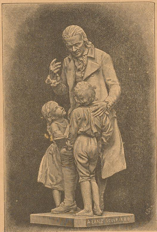
Pestalozzidenkmal in Yverdon.

genommen und erfuhr alle Greuel der Verwüstung und Plünderung. Über 700 Gebäude wurden eingeäschert, und der 22ste Teil der Bevölkerung, Männer, Greise, Frauen und Kinder, im ganzen etwa 400 Personen, niedergemetzelt. Nur etwa 90 Mann fielen im offenen Kampfe. Während ein Schrei der