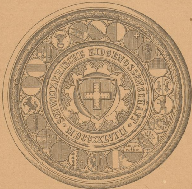
Das eidgenössische Staatsfiegel.

Als Grundrechte, mit denen die kantonalen Verfassungen künftighin nicht im Widerspruche stehen sollten, wurden den Schweizerbürgern u. a. gewährt: die politische Rechtsgleichheit, Pressfreiheit (Vorschriften gegen den Mißbrauch vorbehalten), das Petitionsrecht, das Vereinsrecht, die Unverletzlichkeit des Postgeheimnisses, die freie Religionsausübung und religiöse Gleichberechtigung (jedoch nur „den Gliedern der anerkannt christlichen