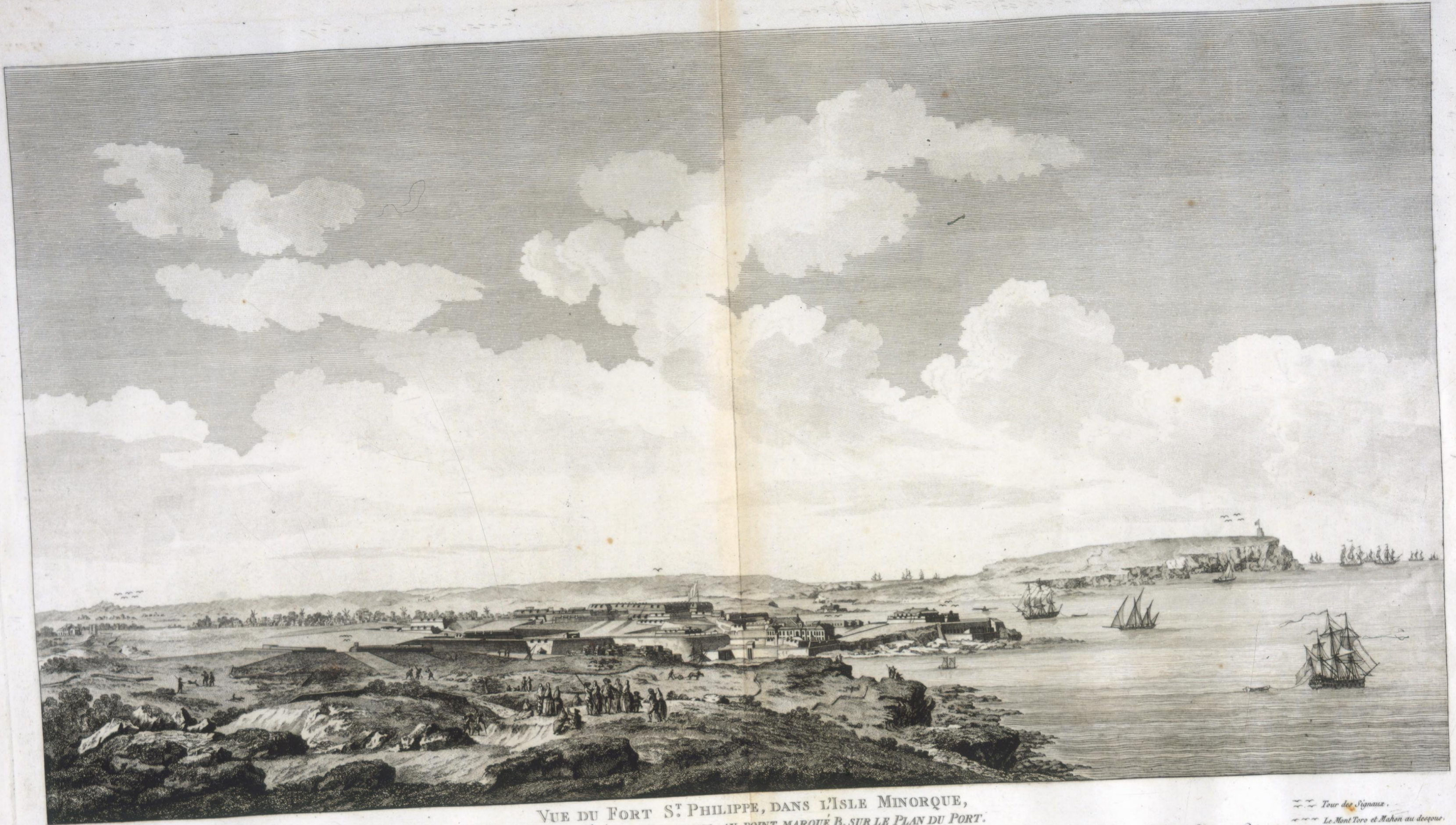
VUE DU FORT S t PHILIPPE, DANS L'ISLE MINORQUE, PRISE DU CÔTÉ DE MALBOROUGH, AU POINT MARQUÉ B. SUR LE PLAN DU PORT.

Le Donjon Le Fort-Philippe Le Fort-S-Charles