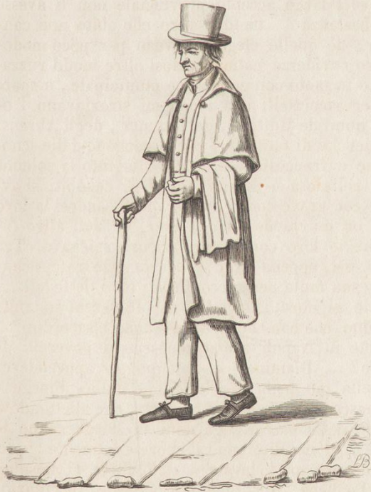
Povero di S. Giovanni