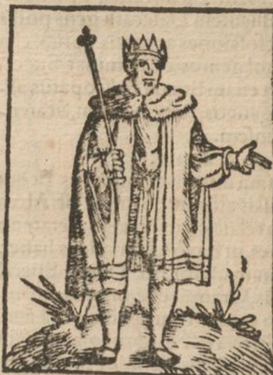
Primus Christianus rex Suecię.

Christi religionem publicē acciperet, & in fonte sacro lotus, Iacobi nomen suscepit. Fuerunt