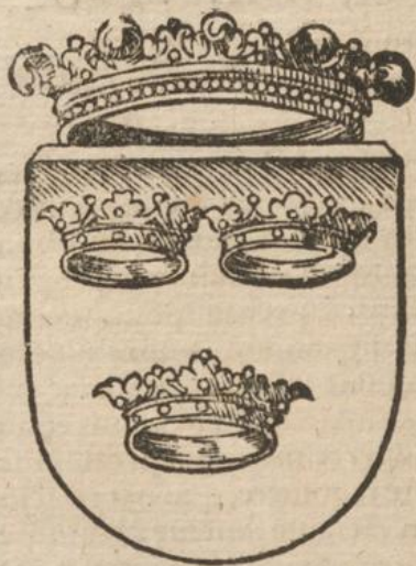
Stockholmia regia ciuitas.

Sueoniam siue Suetiam, & ut uulgò appellant, Sueciam, nunc scrutabimur, florentissimum & latissimū aquilonis regnum, paucisq̃ attingemus situm eius, antiquitates, res gestas, prouentus & diuitias. Habet hæc regio ab occidua sui parte Gothos, à Boreâ Vuermilanos cum Scricfinnis, ab oriēte Finlandiam & Russiā, & ab austro Balticum mare. Est etiam hæc regio inter aquilonares fertilissima, ager frugib. & melle optimus, diues argenti, aris, plumbi, ferri & pecuris, locuples immenso prouētū pisciū ex fluminibus, lacubus, & mari, uenationibus quoq̃ ferarum. In summa, Suecia duplo dicitur excellere regnū Norduegiæ, in magnitudine, in populo, metallis & alijs prouentib. Est tamen in multis locis aspera, montosa & paludiosa, ut non ubiq̃ equitib. & currib. peruia sit. Est in ea Stockholmia urbs mediocris, regia & emporium Suecorum, munita natura & arte. Ea sita est in paludib. instar Venetiarum, inde