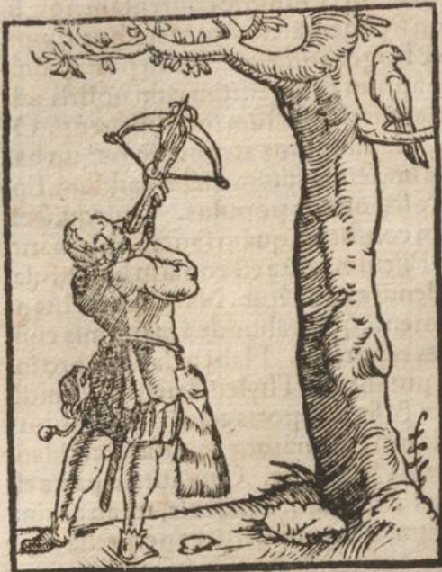
Laponum ne- stium.

propositum signum. Veste utuntur stricta & toti aptata corpori, ne quid impediamenti faciat operi. Hyeme utuntur ueste pellibus integris phocarum siue urforum artificiose laboratis, easque astringunt supra caput, solique oculi patent, corpore reliquo toti contexti sunt, qualisque in culeum insuti. Hinc fortasse creditum, quod sint corpore, hirsuto instar brutorum. Sic uero arte & industria muniti Lapones, perferunt foris hyemes & aquilones & omnem iniuriam à caelo. Domos non habent, sed tabernacula quasi castrensia, mansionesque saepe transferunt. Venationibus plurimum student, quia est magna copia ferarum apud eos, estque nefas si mulier exeat tabernaculum ianua, qua uir eo die est ad uenationem profectus. Agrum non colunt. Terra non fert serpentem, sed culices illic sunt grandes & infesti. Pisces capiunt plurima copia, hocque prouentu uiuunt Ichthiophagorum Aethiopum more, atque ut hi feruore nimio, sic illi frigore ex-