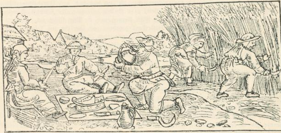
Korn-Ernte. (Aus Calendarium Perpetuum.)

Im Heumonat gab ich dem Lehenburen auf die Sichelösi 80 Maß Wein, die Maaf um 5 Schilling.