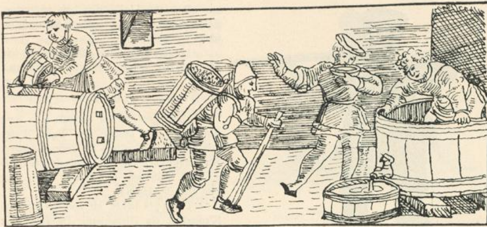
Wein-Bereitung in der Kelter. (Aus Calendarium Perpetuum.)

von 5 Kästen 31 Gld. 6 Baßen. — Den 7 ten Heumonath gab' ich dem Lehnburen das Schnittergeld, so ich ihm jährlich geben muß, als 35 Gulden. Auf die Sichelösi hab' ich ihm 84 Maß Wein gän. — Im Heumonath gab' ich dem Maler für 3 Fahnen die er frisch gemalt hat und für 4 Reiskästen (Koffern) 16 Gulden. Ueberdies malte er die Wappen roth in den Stuben. — Den 31 ten Heumonath hab' ich den Zimmerleuten verdingt bei der obern Mühle einen neuen Wasserstuhl, sammt einem Mählerad zu der untern Mühle zu machen. — Den 30 ten August (9 ten Sept.?) haben wir am Mühlrain gelesen, hat durch den Segen Gottes 12 Saum gegeben.