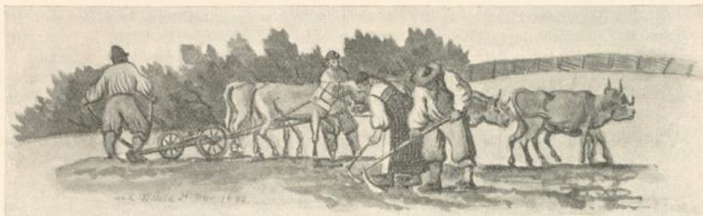
Bauertracht 1682. Nach W. Stettler und Johann Meyer.