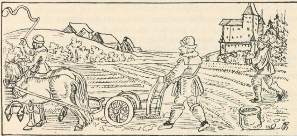
Bestellen des Feldes.

23 ten Herbstmonat hat man mit der Weinlese angefangen, und ist den 3 ten Weinmonat damit fertig geworden und hat durch den Segen Gottes heimgegeben 80 Saum in Wildegg. Der Saum galt 8 Gulden 5 bz.“