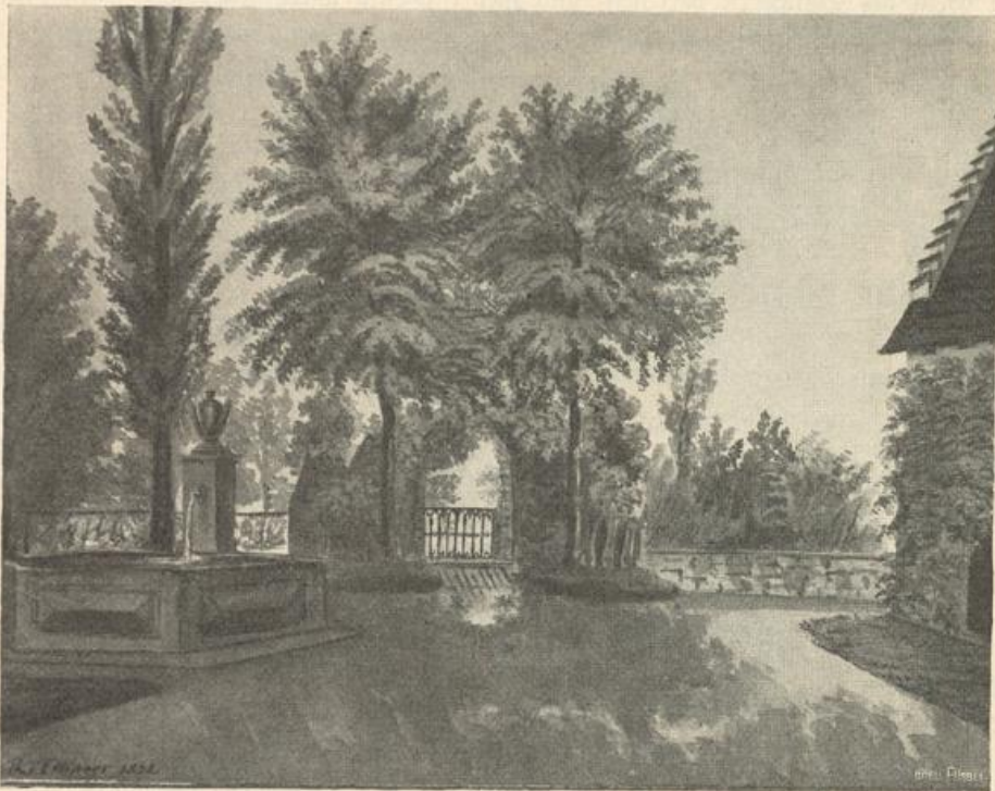
Schloßhof zu Wildegg.

Schlosses. ferner baute er das stattliche Wirtshaus zum Bären, unter dessen steinernem Balkon man die Jahreszahl MCDLXXXII (1692) liest, und daneben das Wohnhaus zur Mühle. Er erstellte das Bauernhaus am Schloßhügel, dem spätere Besitzer leider seinen ursprünglichen, der Landschaft angepaßten Charakter benahmen. Auch die Sennerei auf dem Hard wurde von Junfer Bernhard zu einem stattlichen Pächterhause vergrößert. Den östlichen Giebel zierte er durch eine hölzerne Laube