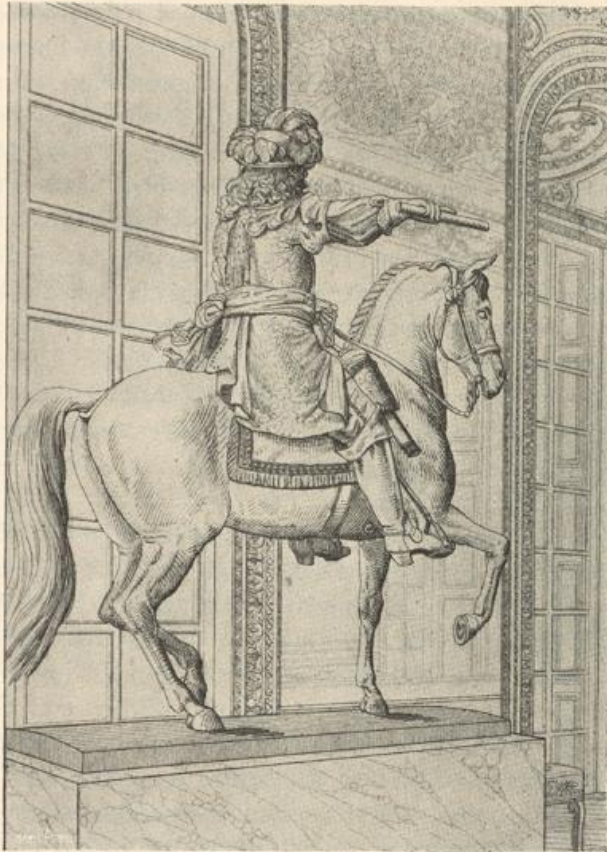
Reiterstatue Ludwigs XIV. in Versailles.