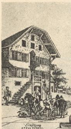
Das Wirtshaus zum Bären bei der Hellmühle.

Von 1678—1725 hat Junker Bernhard nachstehende Bauten aufgeführt: er verband die Türme des Schlosses auf der Nordwestseite durch einen auf mächtigen Quadern von starken Strebepfeilern befestigten Zwischenbau, wo jetzt der Rittersaal und über demselben die Salistube sich befinden. Er erhöhte den Schloßgiebel beträchtlich, wodurch viel Raum gewonnen wurde, und zierte ihn mit weithin sichtbaren, aus den Voluten emporstrebenden Stein-Obelisk; zugleich erneuerte er den von Sachkennern bewunderten Dachstuhl und verschönerte das Innere des