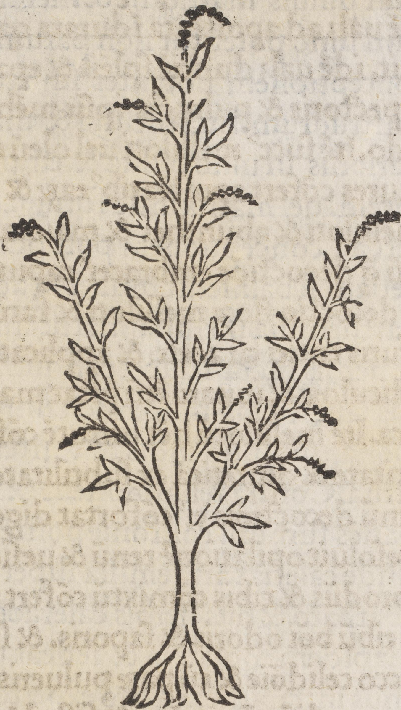
M A T R I C A R I A

M atricaria id est arthemisia quod idem est ut dicit Pandecta capitulo de arthemisia. & dicitur etiam alio nomine mater herbarum. Et est eiusdem complexionis & uirtutis ut arthemisia: existit calida & sicca in tertio gradu. cuius folia competunt usui medicine. Et maioris sunt efficacitae uiridia quam exiccata. Item matricaria confert ad conceptionem perficiendam & contra sterilitatem factam ex humiditate.