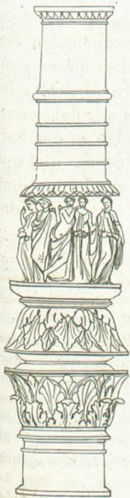
Griechischer Kandelabersturz aus Sicilien.

unserem mykenischen Thesaurus zeigt sich auch die Säule unverkennbar als Sphyrelaton, als getriebenes Metallwerk mit eingelegten Edelsteinen, wenn auch nur in skulptirter Nachbildung. Auch die Thüreinfassung ist ein Pegma, was sie übrigens auch in klassischer griechischer Zeit immer blieb, und dessgleichen das oberste bekrönende Simswerk, nach dem was Vitruv uns von den hölzernen Balkenköpfen des toskanischen Tempels erzählt; es ist mit Brett, Stukko, Metall oder Terrakotta umkleidet. — So wird alles, die Stütze sowie das Gestützte und in gleichem Grade das raumabschliessende Glied, die Wand, nothwendig weiter, voller, pomphafter, geschmückter, als erforderlich und statthaft wäre wenn das unter diesen Bekleidungen versteckte Kerngerüst in der Idee des Architekten das formgebende äusserlich sichtbare Element bildete. 1