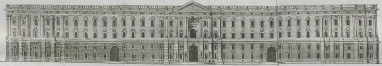
Facciata principale del Real Palazzo di Caserta

Palmi 2 30 100 200 300 400 600 600 Napolitani