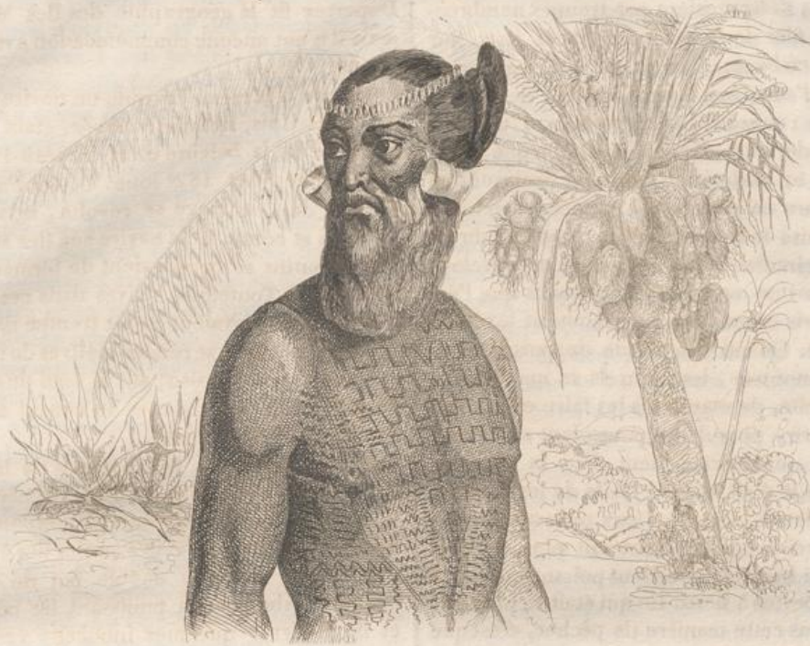
4. Naturo des Iles Sandwich.