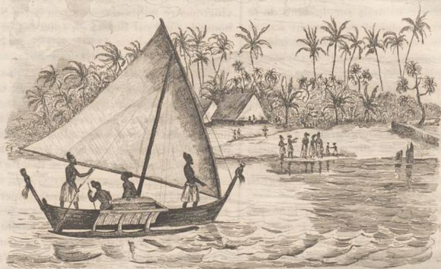
1. Canot du Groupe Kradenstern.