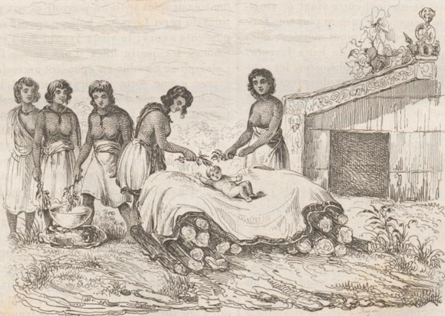
2. Cérémonie d'un Baptême islandais.