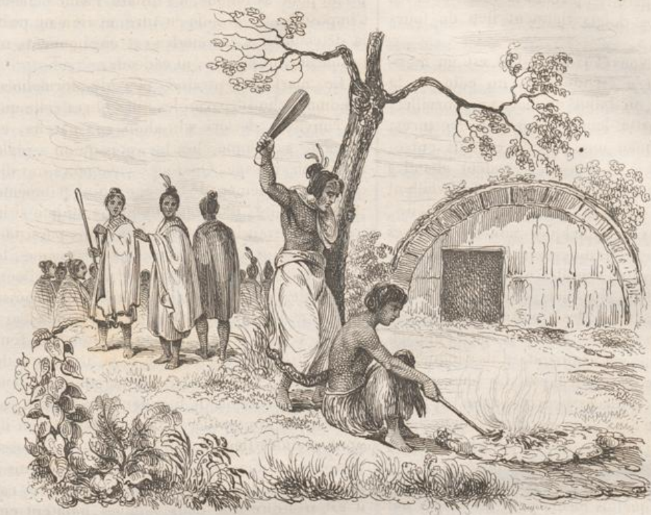
1. Sacrifice humain à la Nouvelle-Hébrides.