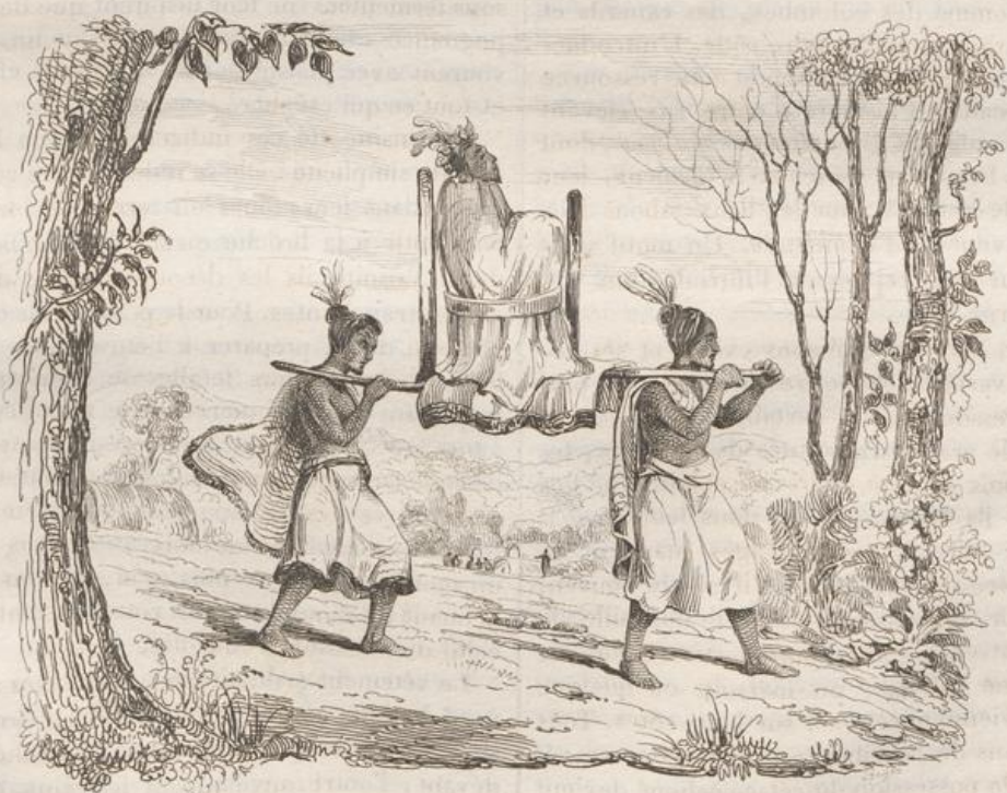
4. Funérailles d'un Arctique.