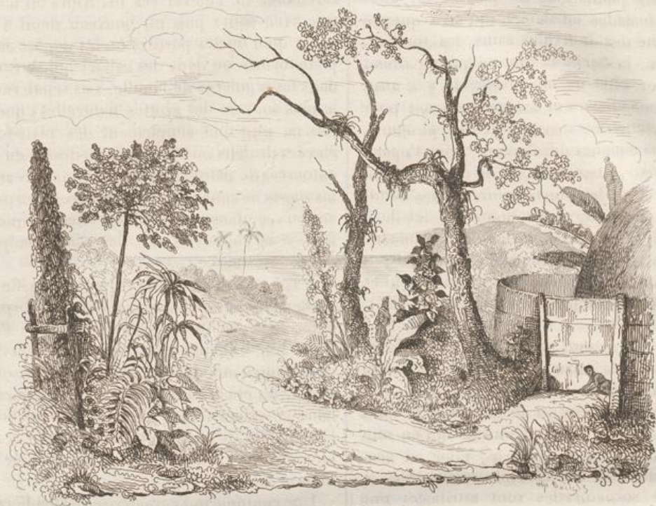
1. Vue de la Nouvelle-Calédonie.