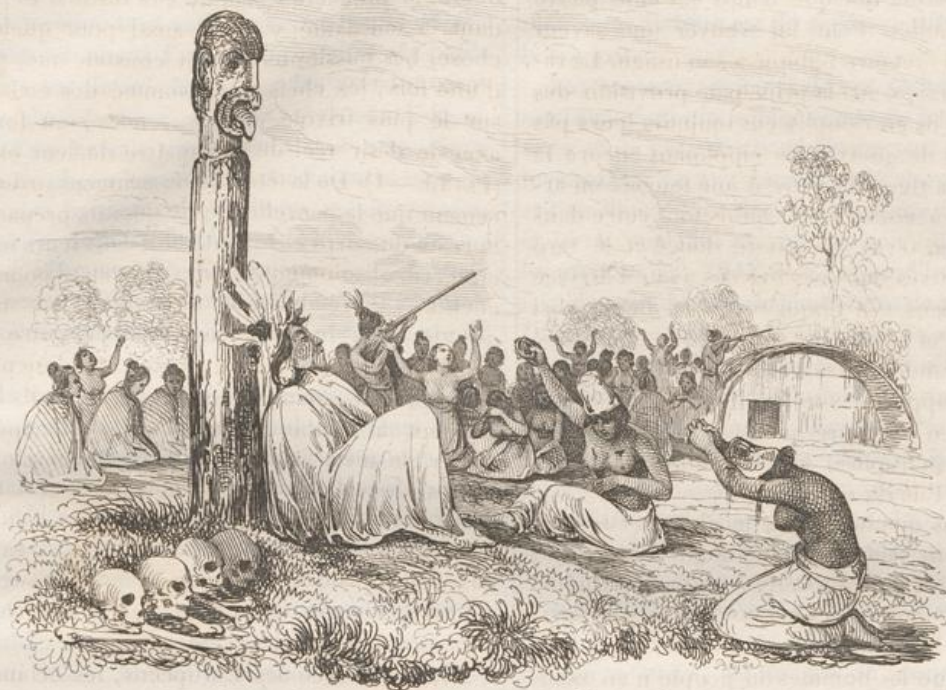
3. Scène de Peuil à la Nouvelle Hollande.