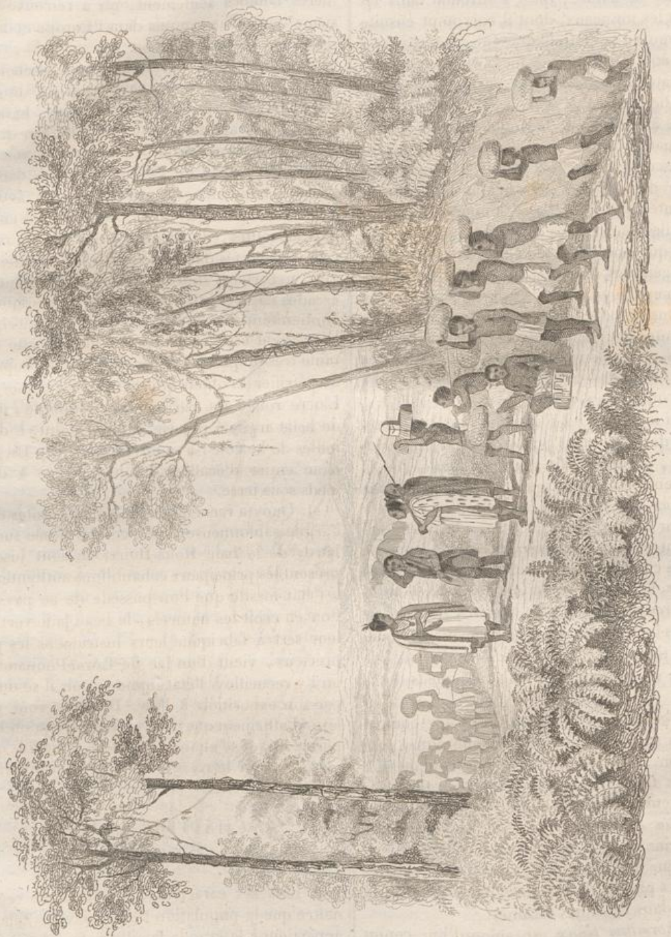
3. Affluence de la Nouvelle-Hollande avec sa suite.