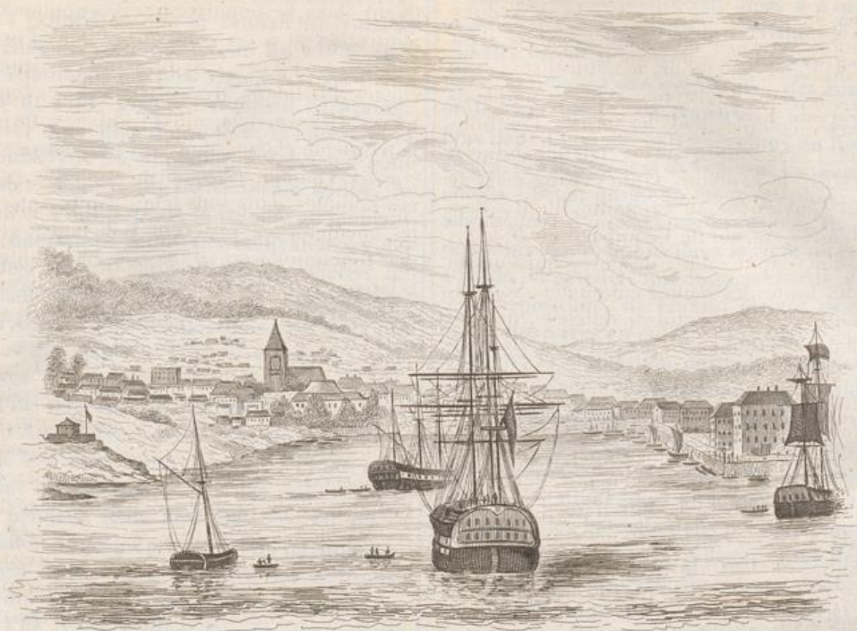
1. Vue de Robert-Town en Fannania.