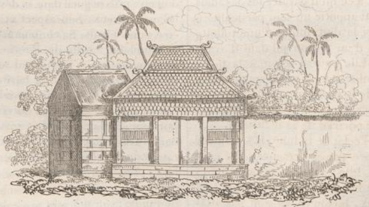
4. Maison d'un Chef Javanais.