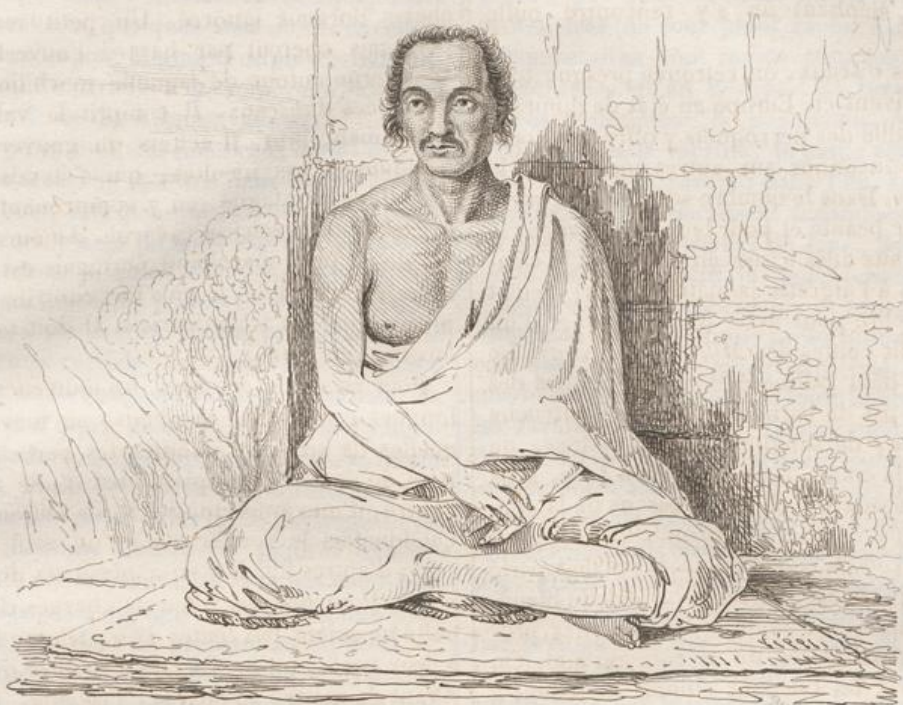
3. Prisonnier de Babil.