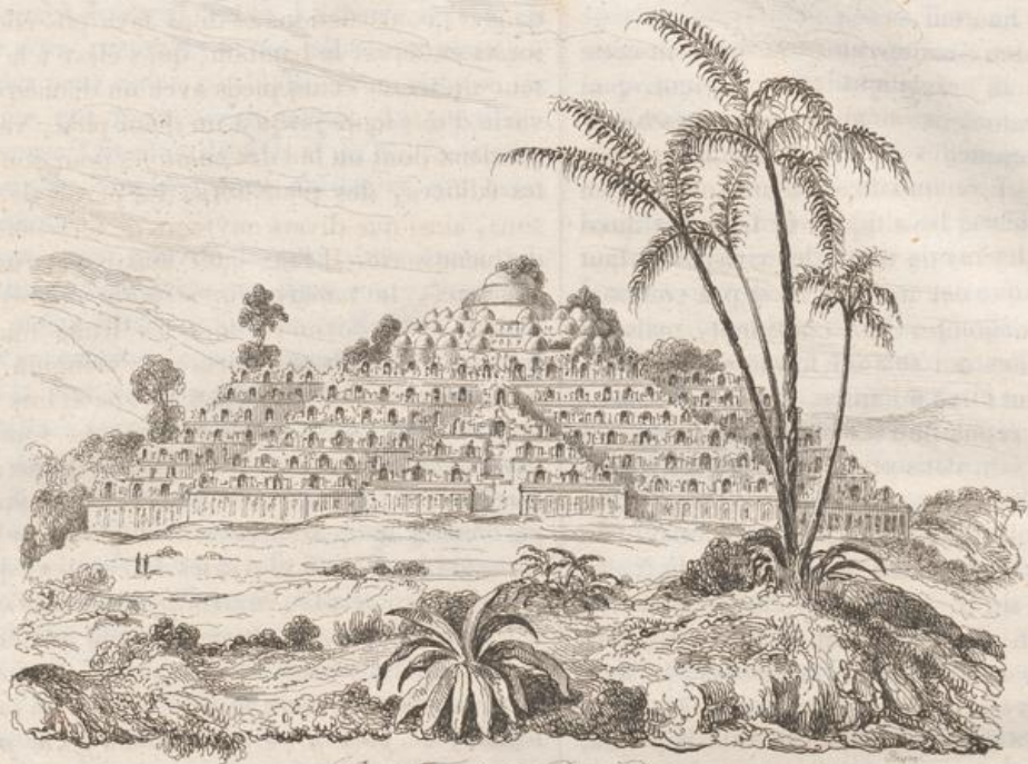
1. Grand Temple de Bon-Bodhi.