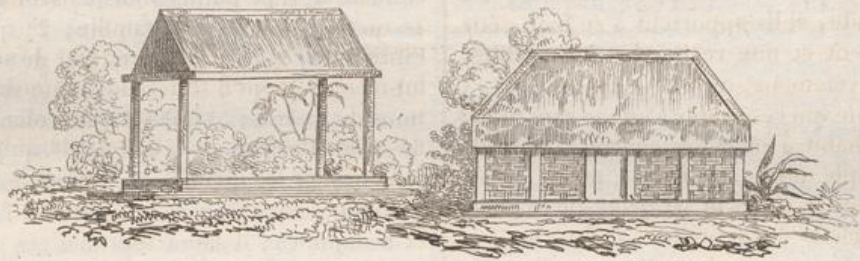
3. Maison de Paysans Javanais.