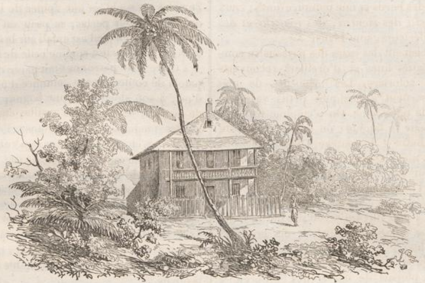
2. Maison Malaise.