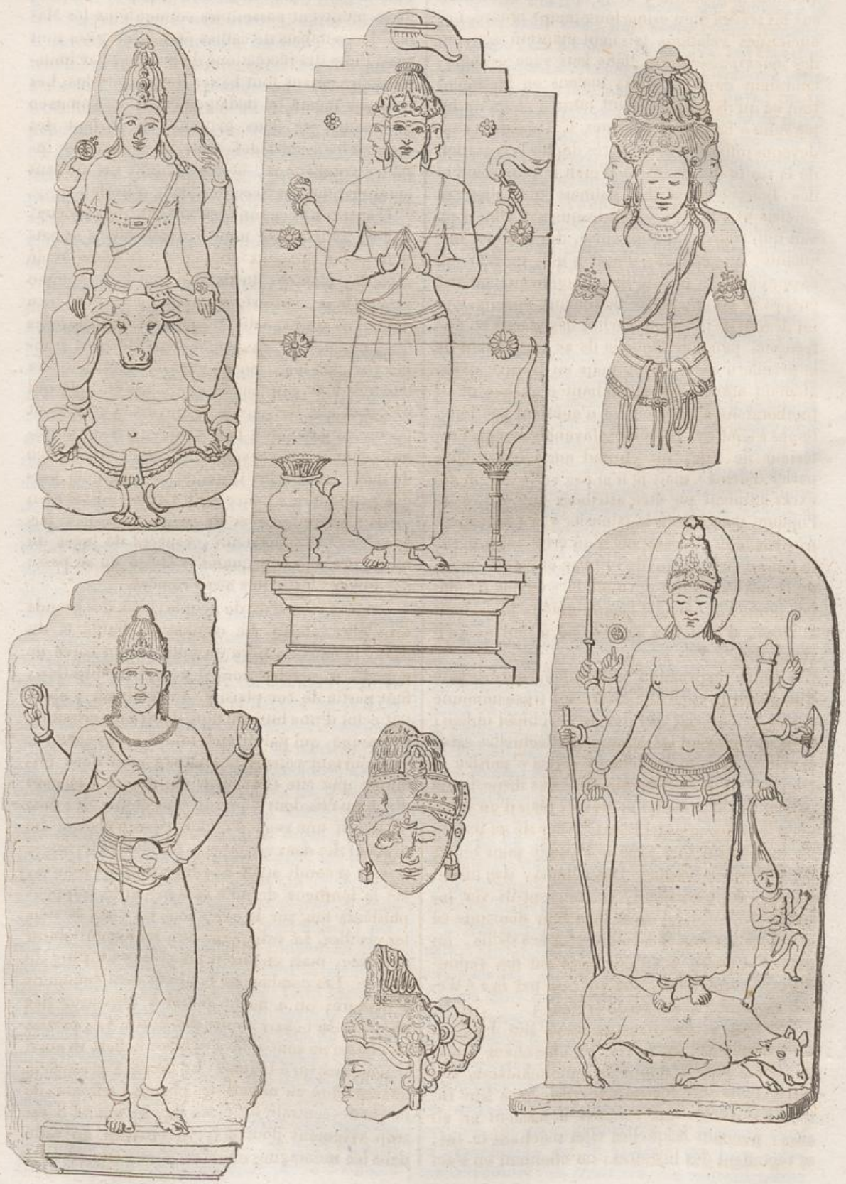
Bas-reliefs en pierre trouvés près de Bom-Bodor.