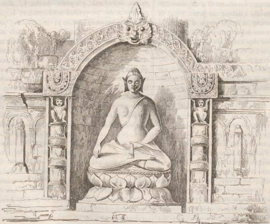
2. Vue des 200 Niches du Temple de Bon-Bodhi.