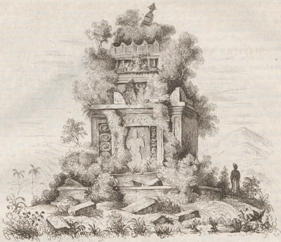
3. Ruines du Temple de Brambanan.