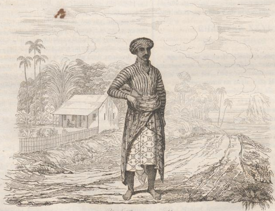
2. Un Habitant de Matore.