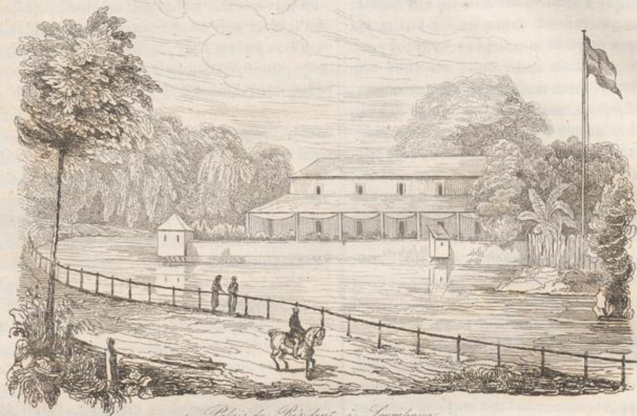
1. Palais du Résident à Sumbawa.