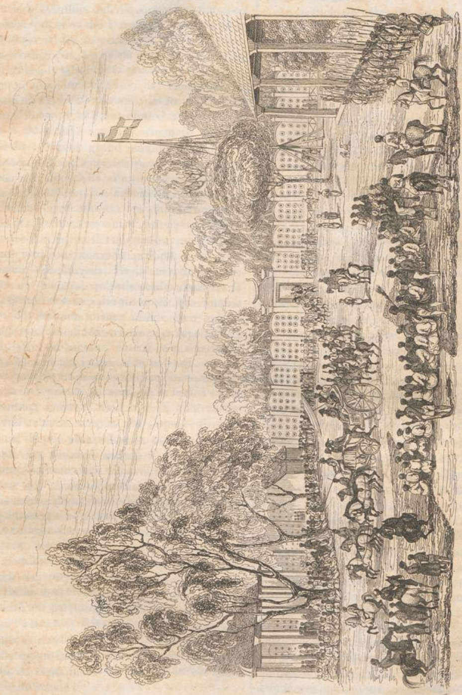
3. Panorama von der Küste von Malabar.