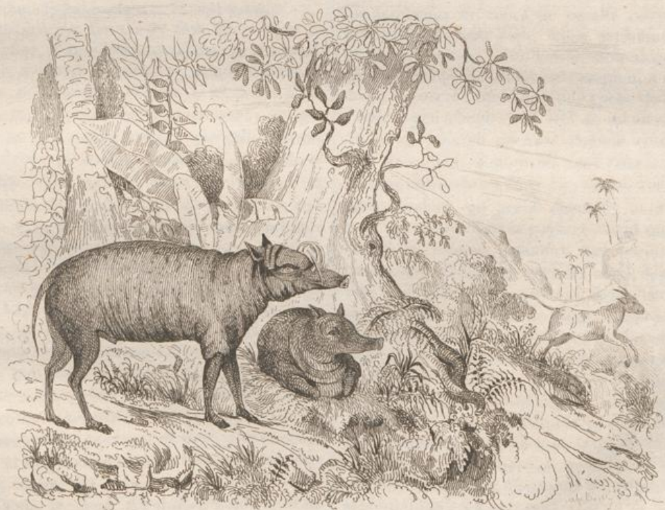
1. Dabirrusus mâle et femelle. 3. Iap. cutony .