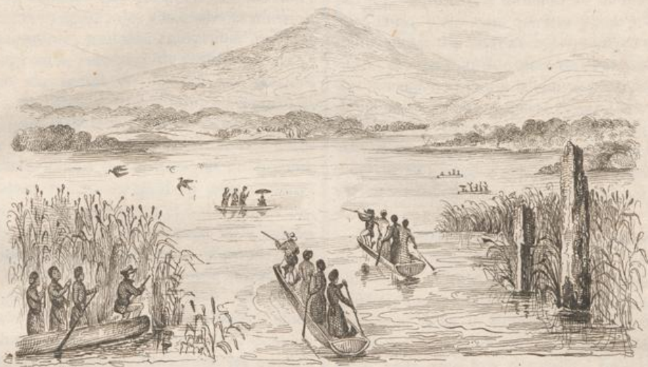
2. Promenade sur le Lac de Toudou.