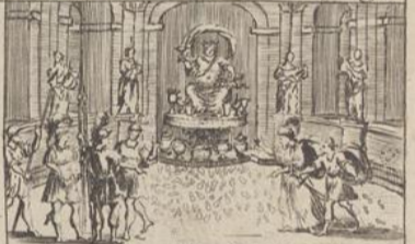
Fraude des Sacrificateurs decouverte