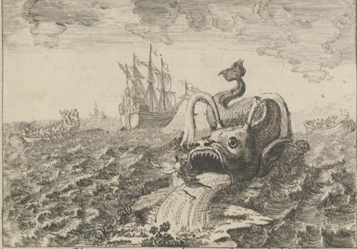
Il remercie Dieu de ce qu'il l'avoit delivré.