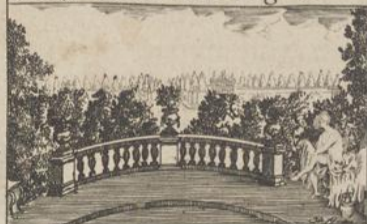
333) Sufanne Fig 1.