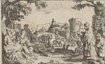
328) Zacharie. Fig 2.