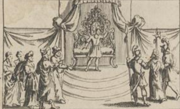
334) Sufanne Fig 2.