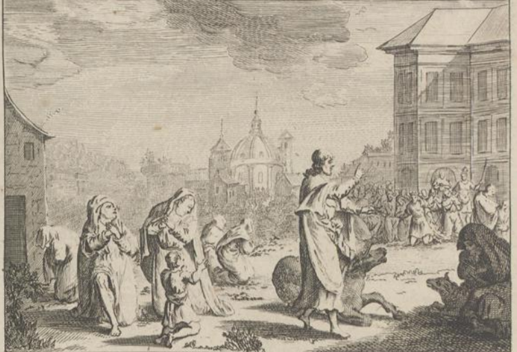
Le Roi & les habitans sont touchés de repentir.