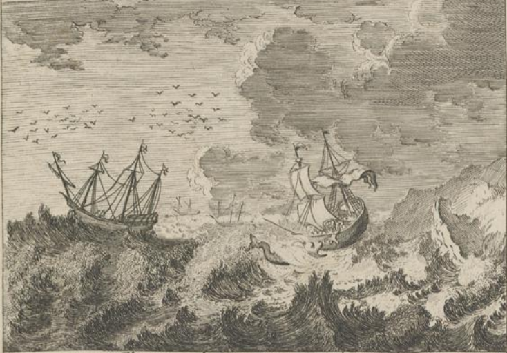
Il est englouti par un grand poisson.