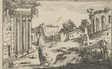
325) Agée. Chap: 1.