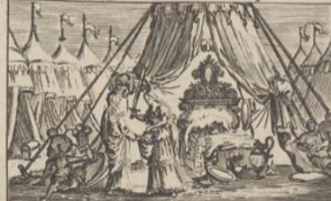
332) Judith. Chap: 13.