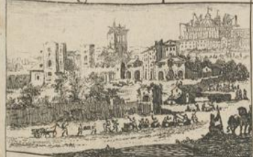
326) Agée Chap: 2.