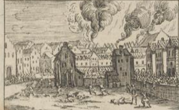
324) Sophonie. Chap: 3