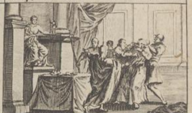
337) 2 Maccabées. Ch 6 & 18 & c