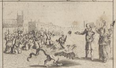
336) Et du Dragon Fig 2.