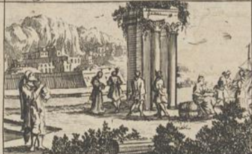
329) Malachie. Fig 1.