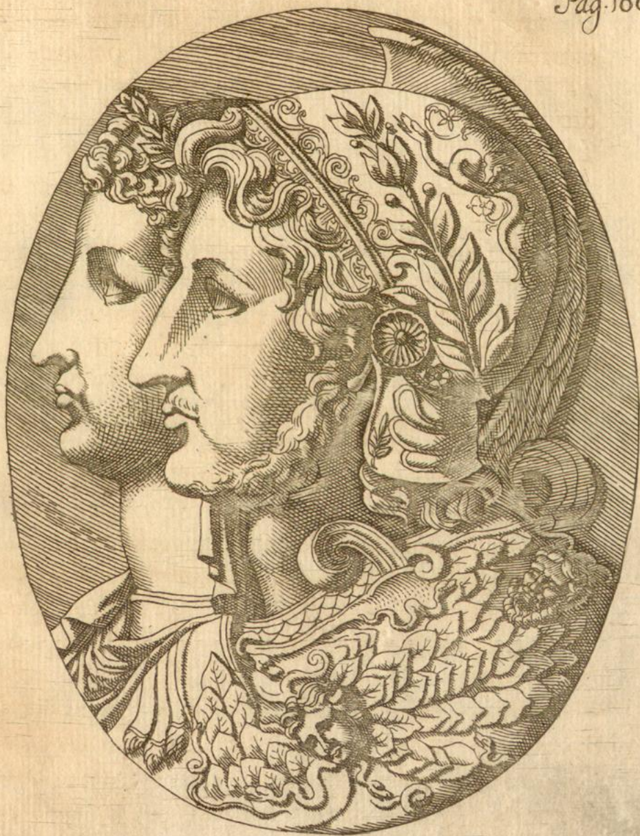
ALEXANDRI MAGNI EIVSQVE MATRIS OLYMPIADIS Imago ex Achate Antiqua Reginae Christinae.