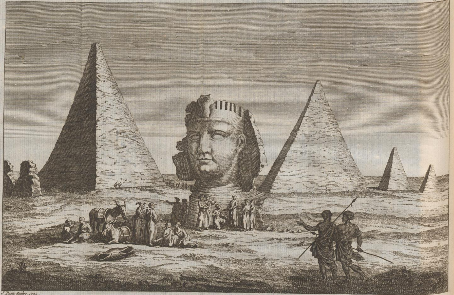
J. Punt. Sculp. 1742.