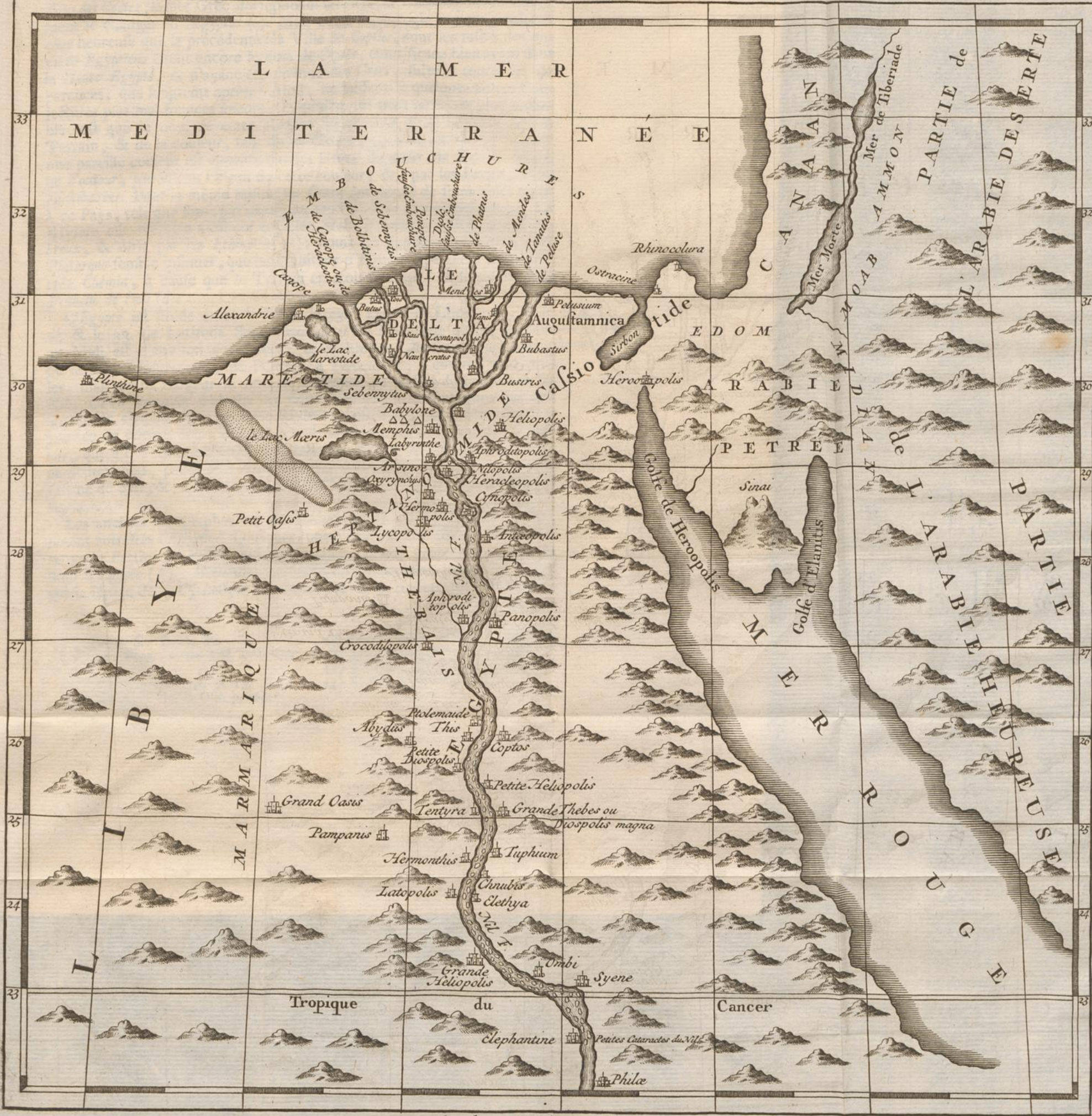
Aux depens d'Arkstee et Merkus.