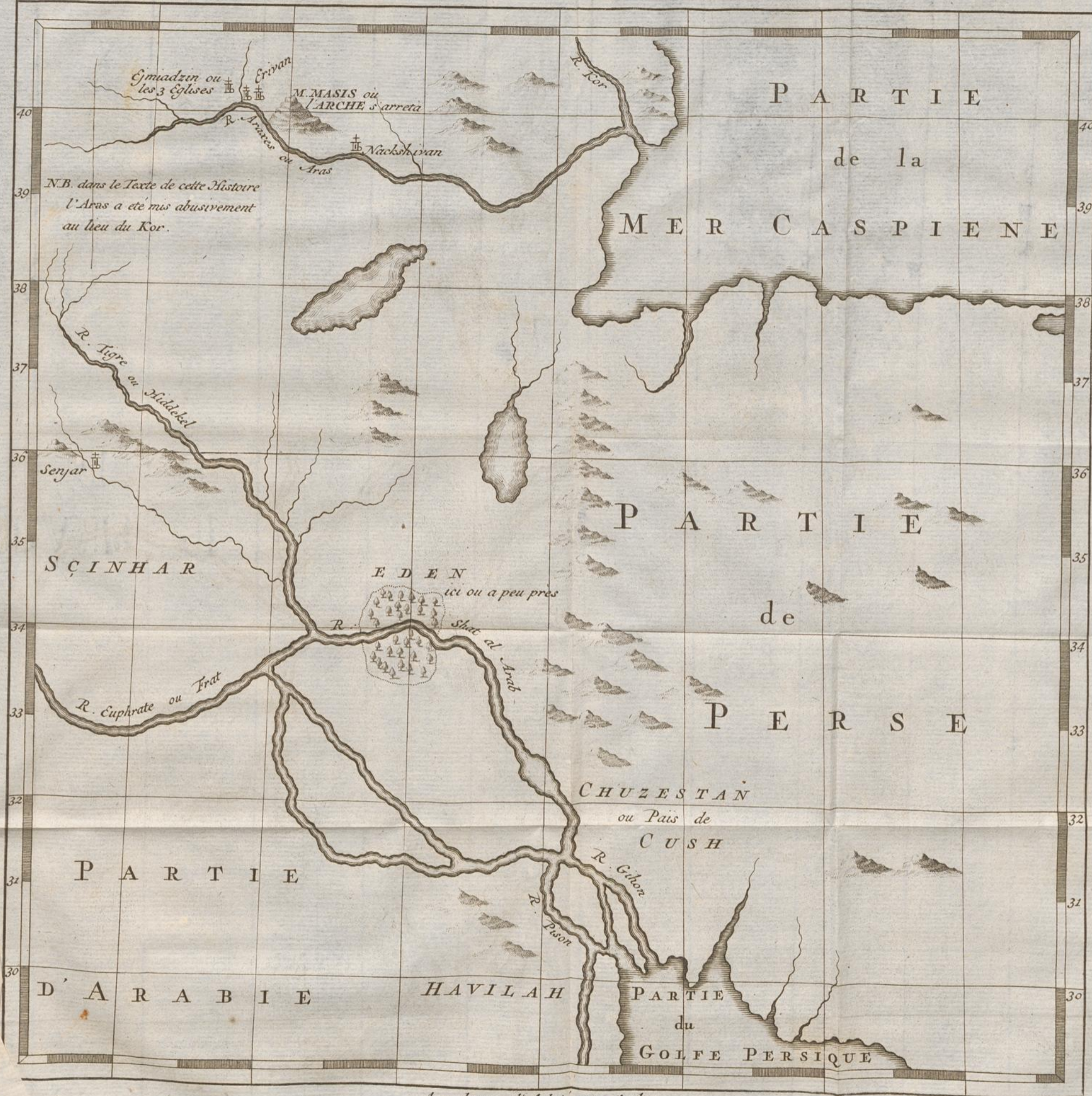
CARTE du pais ou probablement a été le PARADIS TERRESTRE, la plaine de SCINHAR, et la MONTAGNE sur laquelle l'ARCHE s'est arrêtée suivant cette HISTOIRE.