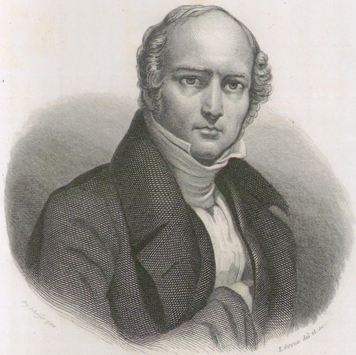
ODILON - BARROT.